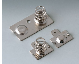
B2904210 Set of battery clips Steel nickel-plated