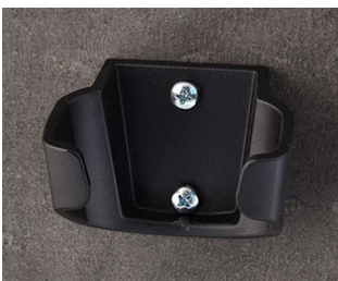
B2904039 Holder L ASA (UL 94 HB) black RAL 9005