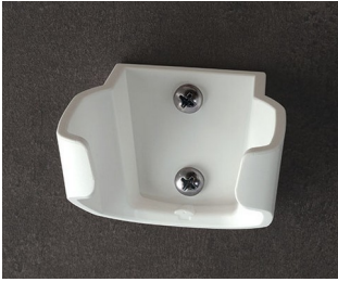
B2903037 Holder M ASA (UL 94 HB) traffic white RAL 9016