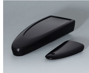
B2803016 STYLE-CASE M PMMA (IR) (UL 94 HB) black RAL 9005 147x56x27mm IP 65 opt., IP 40