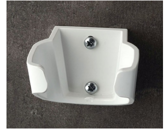
B2904037 Holder L ASA (UL 94 HB) traffic white RAL 9016