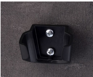
B2902039 Holder S ASA (UL 94 HB) black RAL 9005