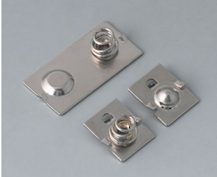
A9190020 Set of battery clips Steel nickel-plated