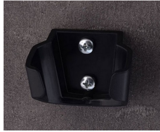
B2903039 Holder M ASA (UL 94 HB) black RAL 9005