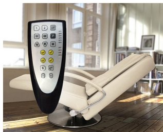
Control unit for Relax and Massage Chairs

Predestinati per svariate tipologie di telecomandi orientate al design. Impiego in particolare in ambito ospedaliero e di istituti sociali, nelle abitazioni e nell'industria.