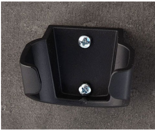
B2904039 Holder L ASA (UL 94 HB) black RAL 9005