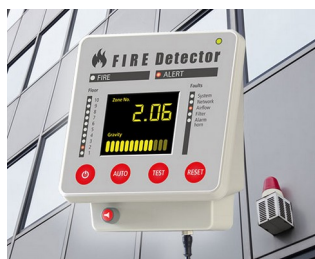
Terminal pour systèmes d'alarme incendie