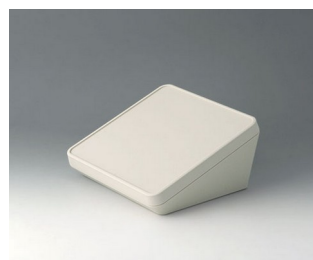
B4418107 PROTEC 180, Vers. I ASA+PC (UL 94 V-0) gris blanc RAL 9002 180x180x92mm IP 65 opt.