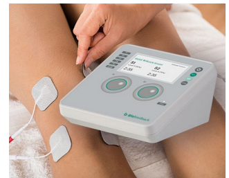
Compteur de biofeedback