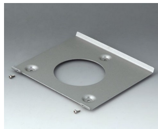
B4522101 Support mural 220 Aluminium