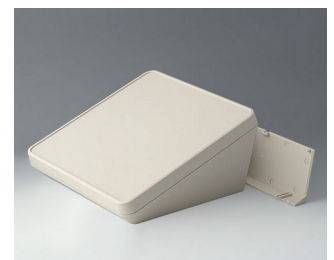
B4422207 PROTEC 220, Vers. II ASA+PC (UL 94 V-0) gris blanc RAL 9002 220x220x108mm IP 65 opt.