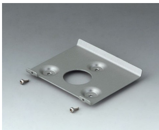
B4514101 Support mural 140 Aluminium