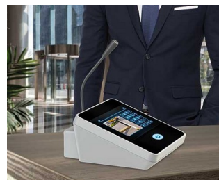
Microphone de table / interphone