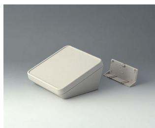
B4414207 PROTEC 140, Vers. II ASA+PC (UL 94 V-0) gris blanc RAL 9002 140x140x76mm IP 65 opt.