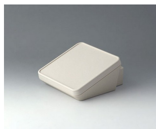
B4414307 PROTEC 140, Vers. III ASA+PC (UL 94 V-0) gris blanc RAL 9002 140x160x76mm IP 65 opt.