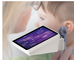
Appareil de test auditif