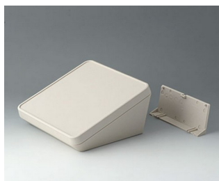
B4418207 PROTEC 180, Vers. II ASA+PC (UL 94 V-0) gris blanc RAL 9002 180x180x92mm IP 65 opt.