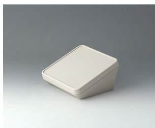
B4414107 PROTEC 140, Vers. I ASA+PC (UL 94 V-0) gris blanc RAL 9002 140x140x76mm IP 65 opt.