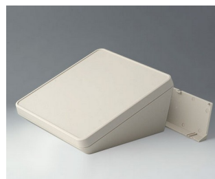
B4422207 PROTEC 220, Vers. II ASA+PC (UL 94 V-0) gris blanc RAL 9002 220x220x108mm IP 65 opt.