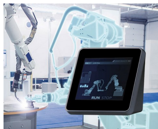
Contrôle des robots