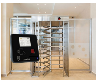
Terminal pour le contrôle d'accès