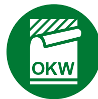
Étiquette, Films de décoration graphique