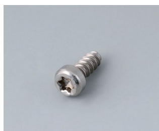
A0325060 Vis autotaraudeuse 2,5 x 6 mm (T8) Acier inoxydable