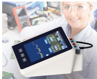
Appareil de mesure multimètre