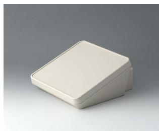
B4418307 PROTEC 180, Vers. III ASA+PC (UL 94 V-0) gris blanc RAL 9002 180x201x92mm IP 65 opt.