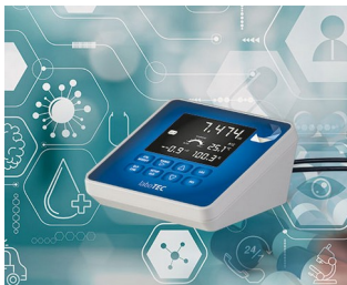
Appareil de mesure de laboratoire

Systèmes de surveillance, contrôle d'accès, systèmes de saisie de données, technique du bâtiment, centres de contrôle, IoT/IIoT, usine intelligente (Smart Factory), Industrie 4.0, périphérie informatique, technique de mesure et de régulation, technique médicale, domaines de la santé, etc.