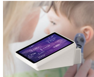
Appareil de test auditif