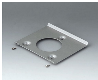
B4518101 Support mural 180 Aluminium