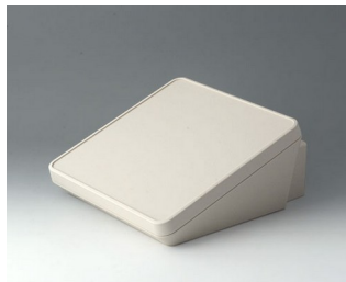
B4422307 PROTEC 220, Vers. III ASA+PC (UL 94 V-0) gris blanc RAL 9002 220x243x108mm IP 65 opt.