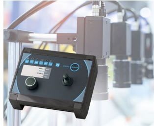
Contrôle caméra en production