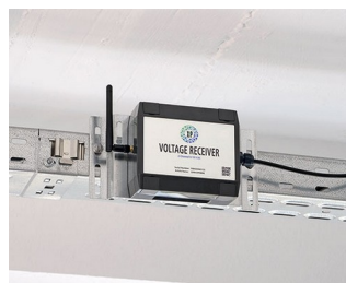
Récepteur de tension