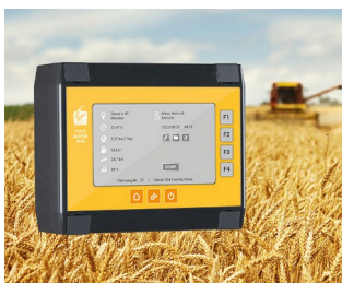
Enregistrement des données pour les moissonneuses