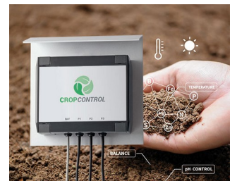
Smart Farming - système pour des mesures à long terme