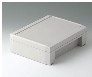
C8017222 SOLID-BOX 175 PC+ABS (UL 94 V-0) gris clair RAL 7035 225x175x70mm IP 66, IP 67, IK 08