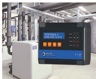
Gestionnaire de température