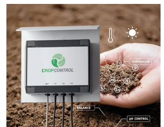
Smart Farming - système pour des mesures à long terme