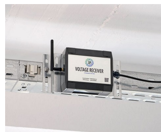
Récepteur de tension