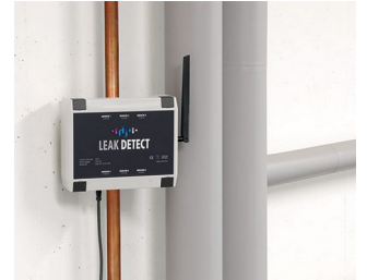
Détecteur de fuite