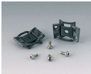
C8100360 Jeu de charnières