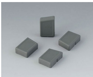
C8100188 Jeu de pieds de boîtier SEBS (TPE) volcan

Sous réserve de modifications techniques. © OKW Gehäusesysteme, Buchen/Allemagne.