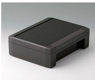
C8017221 SOLID-BOX 175 PC+ABS (UL 94 V-0) gris anthracite RAL 7016 225x175x70mm IP 66, IP 67, IK 08