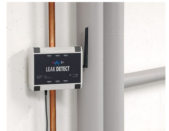
Détecteur de fuite