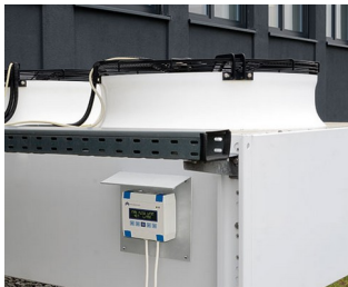
Commande de chauffage/climatisation/ventilation

Boîtiers prédestinés aux applications électriques et électroniques de haute qualité à l'intérieur et à l'extérieur protégé par exemple construction de machines et d'installations, technique de chauffage, de climatisation et de ventilation, IoT/IIoT, smart-Factory / Industrie 4.0, passerelles, enregistreurs de données, technologies de l'information et de la communication (TIC), installation électrique, technique de mesure et de régulation, agriculture, élevage, technologie énergétique et sensorique et technique de sécurité.