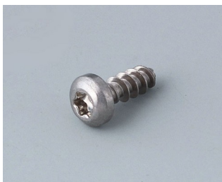
A0308132 Vis autotaraudeuse 3 x 8 mm (T10) Acier inoxydable