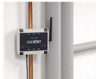
Détecteur de fuite