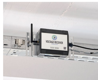
Récepteur de tension