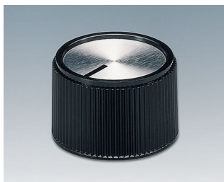
A1320260 BOUTON, à fixation latérale par vis PF noir/alu 20x16mm 6mm