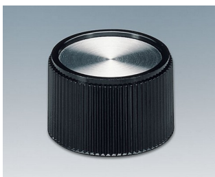
A1328160 BOUTON, à fixation latérale par vis PF noir/alu 28x16mm 6mm