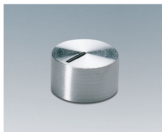
A1412441 BOUTON, à fixation latérale par vis PC brillant 12x7,2mm 4mm