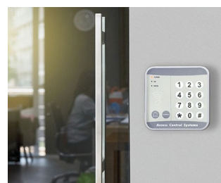
Systèmes de contrôle d'accès