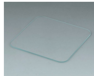
C6502013 Plaque de verre S84 Verre clair 78,75x78,75x1,6mm