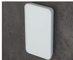
C6406107 SMART-PANEL E155 ASA+PC (UL 94 V-0) blanc signalisation RAL 9016 155x84x21,3mm IP 40