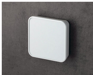
C6402107 SMART-PANEL S84 ASA+PC (UL 94 V-0) blanc signalisation RAL 9016 84x84x21,3mm IP 40