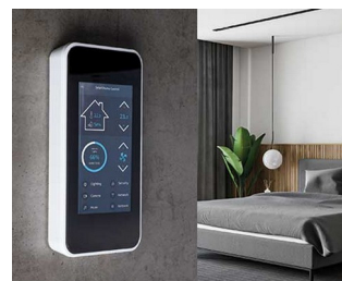
Centrale de commande SMART-HOME