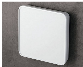
C6404107 SMART-PANEL S114 ASA+PC (UL 94 V-0) blanc signalisation RAL 9016 114x114x21,3mm IP 40