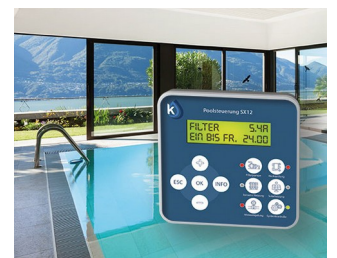
Contrôle de la piscine