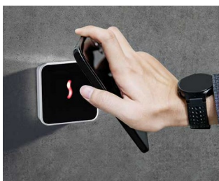
Accès automatique à la porte

Idéal pour les applications électroniques stationnaires en intérieur : technologie des bâtiments, SMART-HOME (la maison intelligente), IoT/IIoT, bureau, communication sans fil, technique de mesure et de régulation, technique médicale et les soins de santé, technique de sécurité, etc.