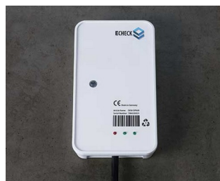
Appareil filaire dans le domaine de l'IIoT