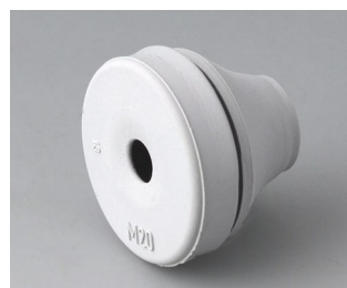
C2320137 Passe-câble EPDM gris clair RAL 7035 IP 67