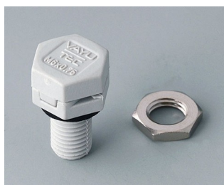
C2306917 Élément à compensation de pression M6x0,75 PA 6 (UL 94 HB) gris clair RAL 7035 IP 56