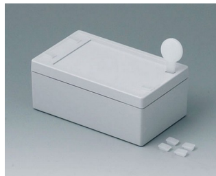
C3006101 SNAPTEC 60 x 100 ABS (UL 94 HB) gris clair RAL 7035 60x100x40mm IP 65