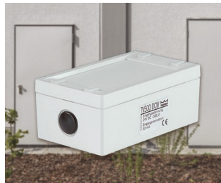
Verrouillage de porte électromécanique