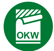
Étiquette, Films de décoration graphique