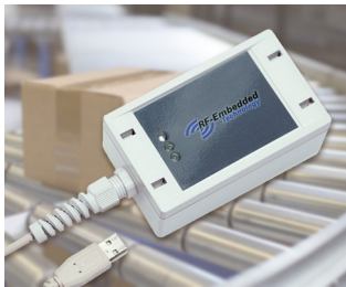
Lecteur UHF robuste

Convient de façon idéale pour les installations électriques, par ex. dans la technique de chauffage, de climatisation et d'aération comme appareils de contrôle-commande, pour la construction mécanique et d'installations, ainsi que pour la technique de sécurité, etc. Utilisable également dans le domaine électronique, par ex. pour les appareils de mesure numériques et analogiques, pour les applications par sondes, comme boîtier d'interfaces, appareils d'alarme, etc.