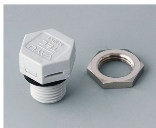
C2310917 Élément à compensation de pression M10x1 PA 6 (UL 94 HB) gris clair RAL 7035 IP 56