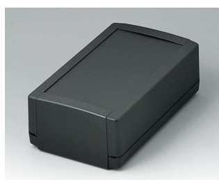
B1070369 TOPTEC 194 H, Vers. I ABS (UL 94 HB) noir RAL 9005 194x115x68mm IP 40