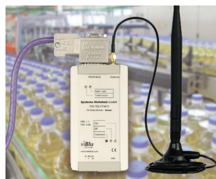
Le système radio PROFIBUS