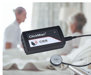
Multicontrolleur adaptatif pour capteurs simples