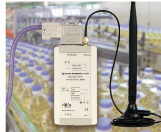
Le système radio PROFIBUS