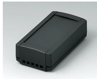
B1040469 TOPTEC 102, Vers. II ABS (UL 94 HB) noir RAL 9005 102x54x30mm IP 40