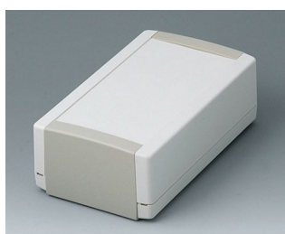
B1070365 TOPTEC 194 H, Vers. I ABS (UL 94 HB) gris blanc RAL 9002 194x115x68mm IP 40