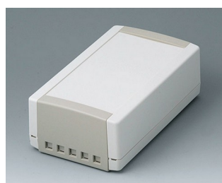
B1070465 TOPTEC 194 H, Vers. II ABS (UL 94 HB) gris blanc RAL 9002 194x115x68mm IP 40