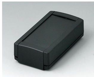
B1040369 TOPTEC 102, Vers. I ABS (UL 94 HB) noir RAL 9005 102x54x30mm IP 40