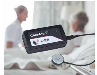
Multicontrolleur adaptatif pour capteurs simples