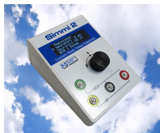
Simulateur de signal biologique