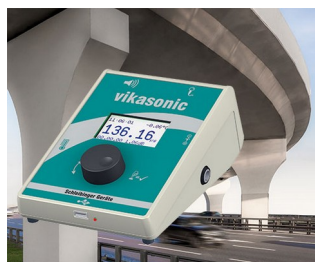
Appareil de mesure à ultrasons