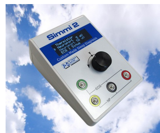
Simulateur de signal biologique