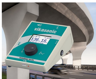
Appareil de mesure à ultrasons

Systèmes de saisie de données, terminaux d'accès et d'information, domotique, périphériques d'ordinateur, communication, applications d'analyse, de diagnostic et de thérapie, technique de mesure et de régulation et commandes industrielles.