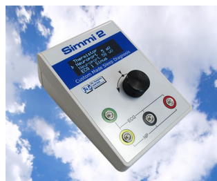
Simulateur de signal biologique