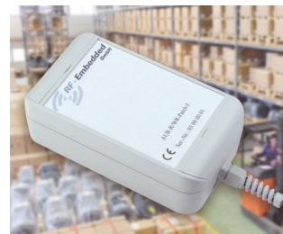
Système UHF RFID actif