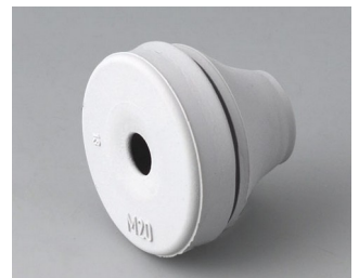
C2320137 Passe-câble EPDM gris clair RAL 7035 IP 67