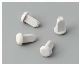
C2299018 Pieds de boîtier TPE (UL 94 HB)

Sous réserve de modifications techniques. © OKW Gehäusesysteme, Buchen/Allemagne.