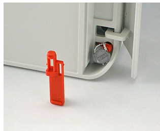
C6100006 Fiche de plombage PA 6 rouge