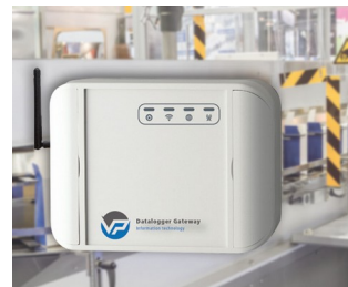
Enregistreur de données pour la surveillance des machines