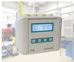
Régulateur de température universel/de température différentielle