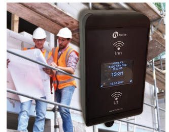
Lecteur de cartes RFID pour les collaborateurs sur chantiers