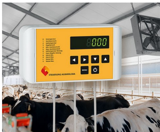
Contrôle climatique agricole

Il est prédestiné aux applications électriques et électroniques fortement orientées au design, par ex. technique de chauffage, climatisation et d'aération, construction de systèmes de contrôle-commande et d'installations, technique de sécurité, IoT/IIoT, industrie 4.0, usine intelligente, etc.