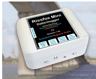
Enregistreur de données miniature pour données climatiques