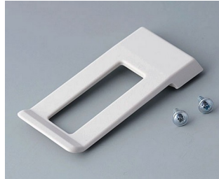
A9172107 Clip de poche ABS (UL 94 HB) gris blanc RAL 9002 62x30mm