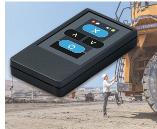
Émetteur radio pour machines