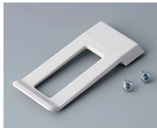
A9172107 Clip de poche ABS (UL 94 HB) gris blanc RAL 9002 62x30mm