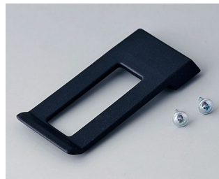
A9172109 Clip de poche ABS (UL 94 HB) noir RAL 9005 62x30mm