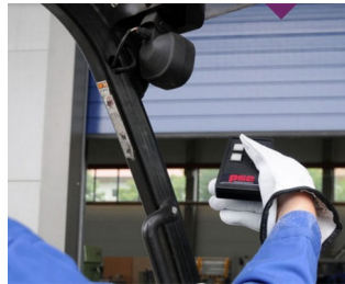
Télécommande IR pour environnements rudes