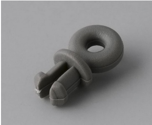
A9100001 Anneau PA 6 volcan