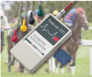
Système télémetrique ECG pour la médecine vétérinaire

Idéal pour les générateurs et récepteur d'impulsions, technique de mesure et de régulation, générateurs d'impulsions pour ultrasons et infrarouges, capteurs, optoélectronique, télécommandes de tout genre, communication sans fil, saisie mobile de données, etc.