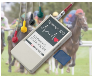
Système télémetrique ECG pour la médecine vétérinaire

Idéal pour les générateurs et récepteur d'impulsions, technique de mesure et de régulation, générateurs d'impulsions pour ultrasons et infrarouges, capteurs, optoélectronique, télécommandes de tout genre, communication sans fil, saisie mobile de données, etc.