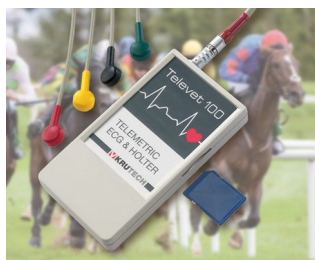
Système télémetrique ECG pour la médecine vétérinaire

Idéal pour les générateurs et récepteur d'impulsions, technique de mesure et de régulation, générateurs d'impulsions pour ultrasons et infrarouges, capteurs, optoélectronique, télécommandes de tout genre, communication sans fil, saisie mobile de données, etc.