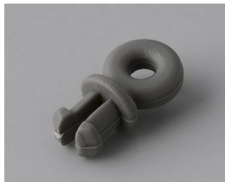
A9100001 Anneau PA 6 volcan