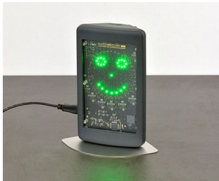
Appareil de mesure de l'air intérieur

Technique de sécurité et de surveillance, technologie environnementale, IoT/IIoT, passerelles, technique de mesure et de commande, technologie des capteurs, technique de régulation, technique médicale et de laboratoire, etc.