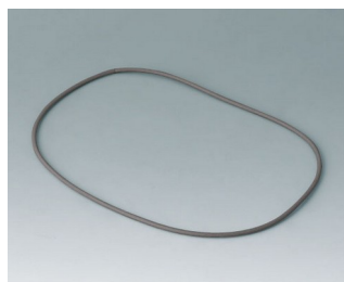
B4710920 Joint M