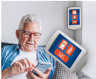
Système d'assistance AAL