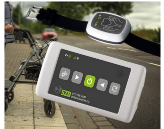
Solution de sécurisation des personnes vulnérables