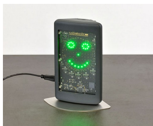
Appareil de mesure de l'air intérieur

Technique de sécurité et de surveillance, technologie environnementale, IoT/IloT, passerelles, technique de mesure et de commande, technologie des capteurs, technique de régulation, technique médicale et de laboratoire, etc.