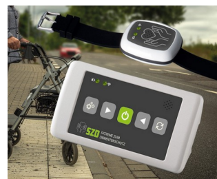
Solution de sécurisation des personnes vulnérables