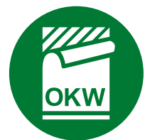
Étiquette, Films de décoration graphique