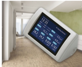
Appareil de mesure des aérosols