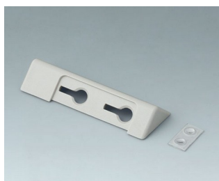
B4705207 Kit support de table ASA+PC (UL 94 V-0)