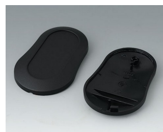
B9004906 Partie inférieure et supérieure DM PMMA (IR) (UL 94 HB) noir RAL 9005 70x44x16mm