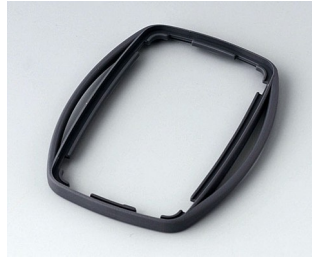
B9004752 Bague intermédiaire EM TPE lava