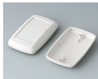
B9006817 Partie inférieure et supérieure EL ABS (UL 94 HB) gris blanc RAL 9002 78x48x24mm