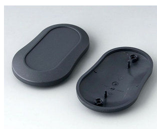
B9006908 Partie inférieure et supérieure DL ABS (UL 94 HB) lava 84x53x19mm