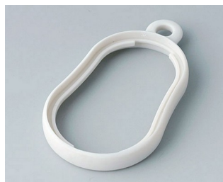
B9002357 Bague intermédiaire DS SEBS (TPE) gris blanc RAL 9002