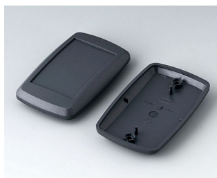
B9006808 Partie inférieure et supérieure EL ABS (UL 94 HB) lava 78x48x20mm