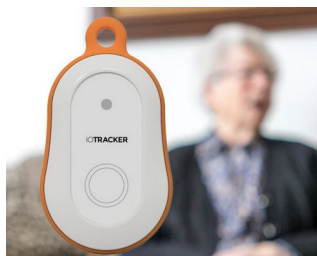
Traceur GPS LoRa avec bouton d'alarme