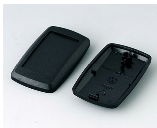
B9002806 Partie inférieure et supérieure ES PMMA (IR) (UL 94 HB) noir RAL 9005 52x32x15mm