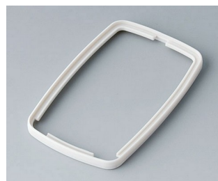
B9006787 Bague intermédiaire EL SEBS (TPE) gris blanc RAL 9002