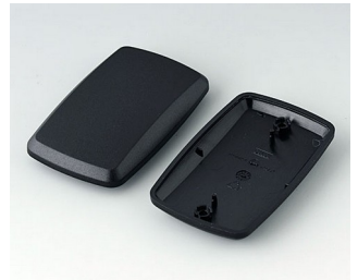
B9006856 Partie inférieure et supérieure EL PMMA (IR) (UL 94 HB) noir RAL 9005 78x48x20mm