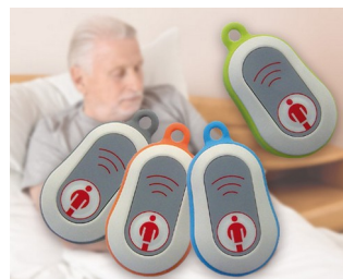
Émetteur d'appel radio en médaillon