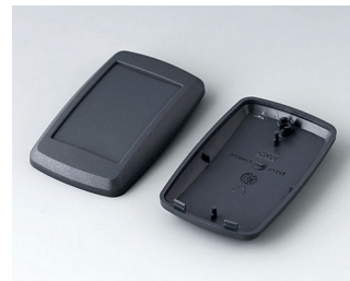
B9004808 Partie inférieure et supérieure EM ABS (UL 94 HB) lava 68x42x18mm