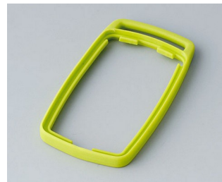
B9002704 Bague intermédiaire ES TPE vert