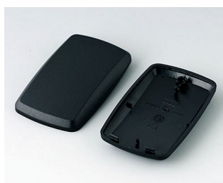
B9004856 Partie inférieure et supérieure EM PMMA (IR) (UL 94 HB) noir RAL 9005 68x42x18mm