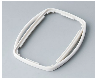
B9004757 Bague intermédiaire EM SEBS (TPE) gris blanc RAL 9002