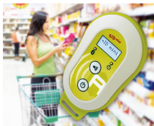
Appareil de lecture mobile UHF-RFID

Multitude de télécommandes en tout genre. En particulier dans le domaine clinique et social, dans le domaine domestique et industriel, par ex. pour les systèmes de secours, appareils de surveillance et de signalisation, les télécommandes radio, etc. Solutions USB mobiles, par ex. dispositif compact de mesure avec enregistrement de données utilisé comme une clé USB. IoT/IloT. Technologie intelligente.