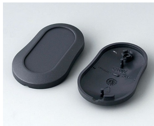
B9002908 Partie inférieure et supérieure DS ABS (UL 94 HB) lava 51x32x13mm