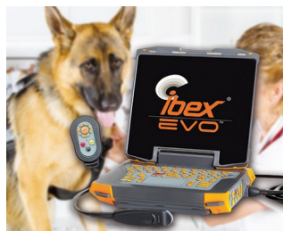
Appareil portable à ultrasons pour la médecine vétérinaire