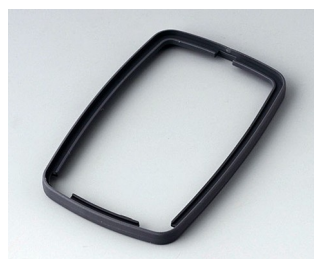
B9006782 Bague intermédiaire EL SEBS (TPE) lava