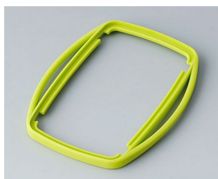
B9006754 Bague intermédiaire EL SEBS (TPE) vert