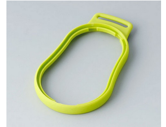
B9004304 Bague intermédiaire DM TPE vert