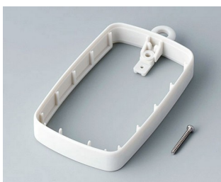
B9004787 Bague intermédiaire EM, surélevé SEBS (TPE) gris blanc RAL 9002