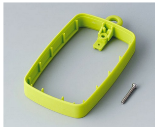
B9004784 Bague intermédiaire EM, surélevé SEBS (TPE) vert