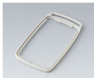
B9006707 Bague intermédiaire EL SEBS (TPE) gris blanc RAL 9002