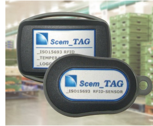
Capteur transpondeur et enregistreur de données RFID