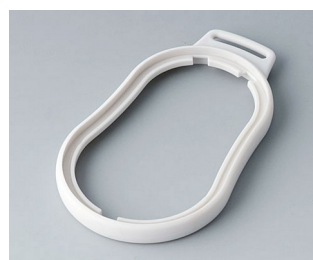
B9006307 Bague intermédiaire DL SEBS (TPE) gris blanc RAL 9002