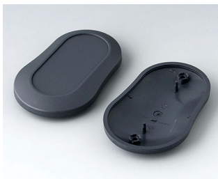
B9006908 Partie inférieure et supérieure DL ABS (UL 94 HB) lava 84x53x19mm