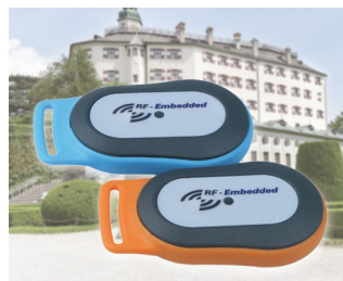
Système d'information RFID mobile