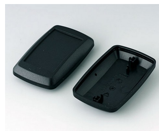
B9006826 Partie inférieure et supérieure EL PMMA (IR) (UL 94 HB) noir RAL 9005 78x48x26mm