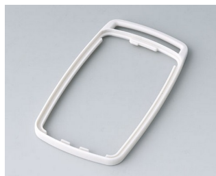
B9004707 Bague intermédiaire EM TPE gris blanc RAL 9002