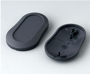
B9002908 Partie inférieure et supérieure DS ABS (UL 94 HB) lava 51x32x13mm