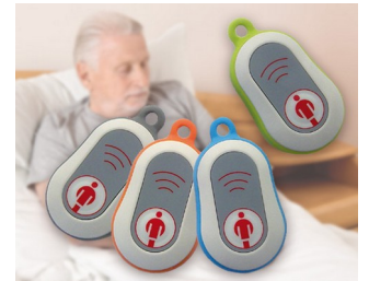
Émetteur d'appel radio en médaille