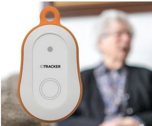
Traceur GPS LoRa avec bouton d'alarme