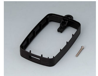
B9004796 Bague intermédiaire EM, type A USB PMMA (IR) (UL 94 HB) noir RAL 9005