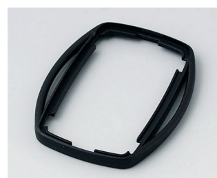
B9002759 Bague intermédiaire ES ABS (UL 94 HB) noir RAL 9005