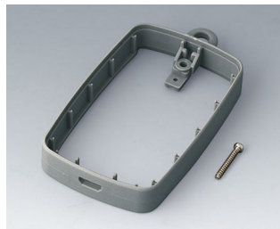
B9004778 Bague intermédiaire EM, Micro USB 5 P, B Type SMT SEBS (TPE) volcan