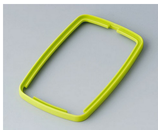
B9006784 Bague intermédiaire EL SEBS (TPE) vert