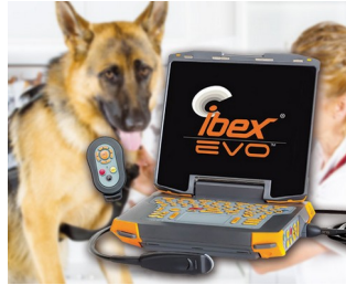
Appareil portable à ultrasons pour la médecine vétérinaire