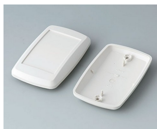
B9006807 Partie inférieure et supérieure EL ABS (UL 94 HB) gris blanc RAL 9002 78x48x20mm