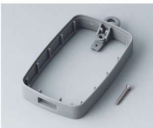
B9004798 Bague intermédiaire EM, type A USB TPE volcan