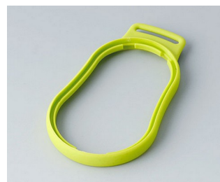
B9004304 Bague intermédiaire DM TPE vert