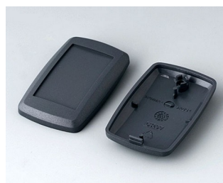
B9002808 Partie inférieure et supérieure ES ABS (UL 94 HB) lava 52x32x15mm