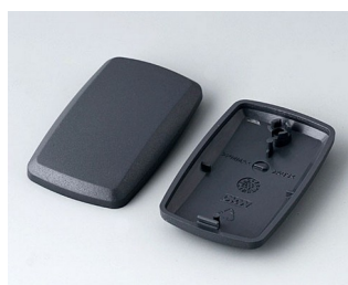
B9002858 Partie inférieure et supérieure ES ABS (UL 94 HB) lava 52x32x15mm