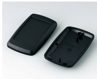
B9004806 Partie inférieure et supérieure EM PMMA (IR) (UL 94 HB) noir RAL 9005 68x42x18mm