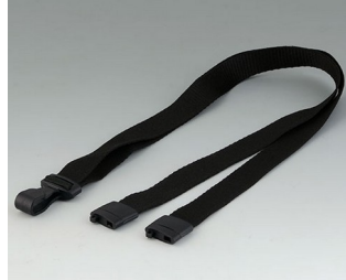
B9100073 Collier, textile noir 914x16mm

Sous réserve de modifications techniques. © OKW Gehäusesysteme, Buchen/Allemagne.