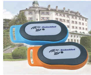
Système d'information RFID mobile