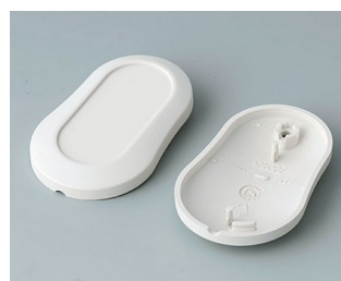
B9002907 Partie inférieure et supérieure DS ABS (UL 94 HB) gris blanc RAL 9002 51x32x13mm