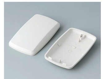
B9004857 Partie inférieure et supérieure EM ABS (UL 94 HB) gris blanc RAL 9002 68x42x18mm