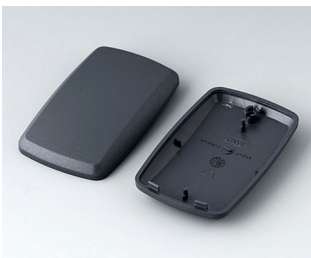
B9004858 Partie inférieure et supérieure EM ABS (UL 94 HB) lava 68x42x18mm