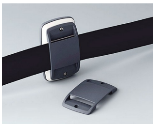
B9106108 Oeillet de fixation passe- dragonne EL ABS (UL 94 HB) lava