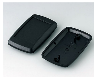
B9006806 Partie inférieure et supérieure EL PMMA (IR) (UL 94 HB) noir RAL 9005 78x48x20mm