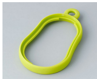
B9002354 Bague intermédiaire DS TPE vert