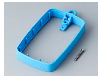
B9004785 Bague intermédiaire EM, surélevé TPE bleu