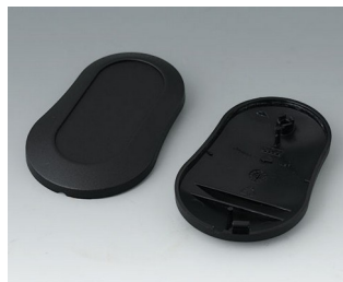
B9004906 Partie inférieure et supérieure DM PMMA (IR) (UL 94 HB) noir RAL 9005 70x44x16mm