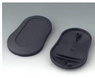
B9004908 Partie inférieure et supérieure DM ABS (UL 94 HB) lava 70x44x16mm