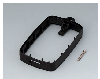
B9004796 Bague intermédiaire EM, type A USB PMMA (IR) (UL 94 HB) noir RAL 9005