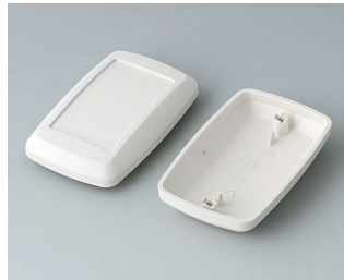
B9006827 Partie inférieure et supérieure EL ABS (UL 94 HB) gris blanc RAL 9002 78x48x26mm