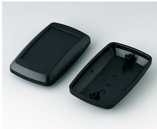
B9006826 Partie inférieure et supérieure EL PMMA (IR) (UL 94 HB) noir RAL 9005 78x48x26mm