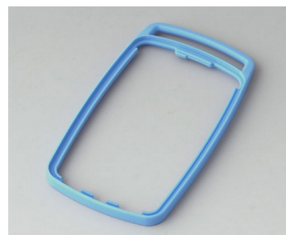
B9004705 Bague intermédiaire EM TPE bleu