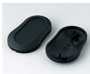
B9002906 Partie inférieure et supérieure DS PMMA (IR) (UL 94 HB) noir RAL 9005 51x32x13mm