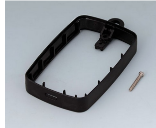
B9004779 Bague intermédiaire EM, Micro USB 5 P, B Type SMT ABS (UL 94 HB) noir RAL 9005