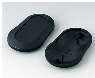
B9006906 Partie inférieure et supérieure DL PMMA (IR) (UL 94 HB) noir RAL 9005 84x53x19mm