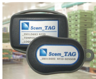
Capteur transpondeur et enregistreur de données RFID