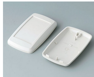
B9004807 Partie inférieure et supérieure EM ABS (UL 94 HB) gris blanc RAL 9002 68x42x18mm