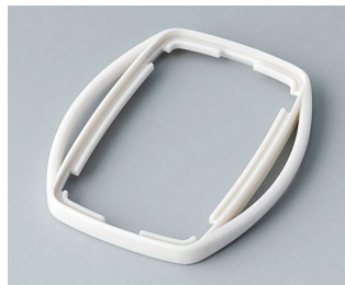
B9002757 Bague intermédiaire ES TPE gris blanc RAL 9002