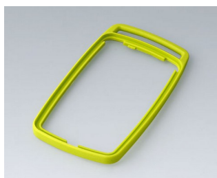
B9006704 Bague intermédiaire EL SEBS (TPE) vert