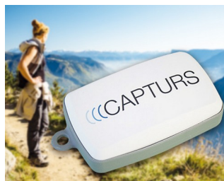
Tracker GPS en temps réel