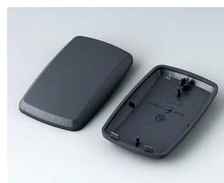
B9004858 Partie inférieure et supérieure EM ABS (UL 94 HB) lava 68x42x18mm