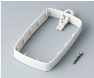
B9004787 Bague intermédiaire EM, surélevé SEBS (TPE) gris blanc RAL 9002