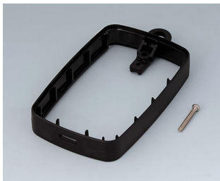
B9004776 Bague intermédiaire EM, Micro USB 5 P, B Type SMT PMMA (IR) (UL 94 HB) noir RAL 9005