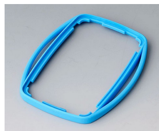
B9004755 Bague intermédiaire EM TPE bleu