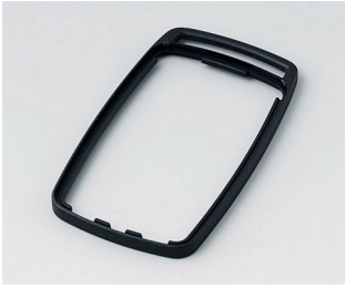
B9004709 Bague intermédiaire EM ABS (UL 94 HB) noir RAL 9005