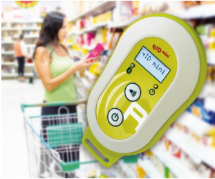
Appareil de lecture mobile UHF-RFID

Multitude de télécommandes en tout genre. En particulier dans le domaine clinique et social, dans le domaine domestique et industriel, par ex. pour les systèmes de secours, appareils de surveillance et de signalisation, les télécommandes radio, etc. Solutions USB mobiles, par ex. dispositif compact de mesure avec enregistrement de données utilisé comme une clé USB. IoT/IloT. Technologie intelligente.