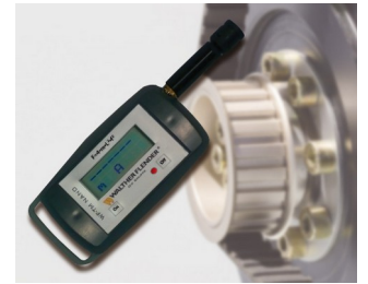
Tensiomètre pour mesurer la prétention de courroies