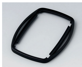
B9006756 Bague intermédiaire EL PMMA (IR) (UL 94 HB) noir RAL 9005