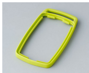
B9002704 Bague intermédiaire ES TPE vert