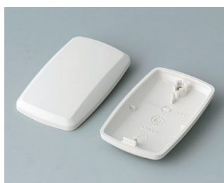
B9002857 Partie inférieure et supérieure ES ABS (UL 94 HB) gris blanc RAL 9002 52x32x15mm