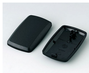
B9002856 Partie inférieure et supérieure ES PMMA (IR) (UL 94 HB) noir RAL 9005 52x32x15mm