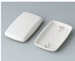
B9006857 Partie inférieure et supérieure EL ABS (UL 94 HB) gris blanc RAL 9002 78x48x20mm