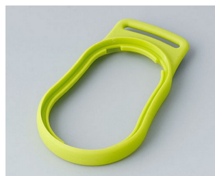
B9002304 Bague intermédiaire DS SEBS (TPE) vert