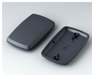
B9006858 Partie inférieure et supérieure EL ABS (UL 94 HB) lava 78x48x20mm