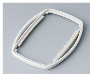
B9006757 Bague intermédiaire EL TPE gris blanc RAL 9002