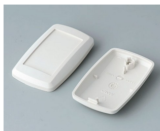
B9002807 Partie inférieure et supérieure ES ABS (UL 94 HB) gris blanc RAL 9002 52x32x15mm