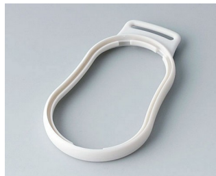
B9004307 Bague intermédiaire DM SEBS (TPE) gris blanc RAL 9002