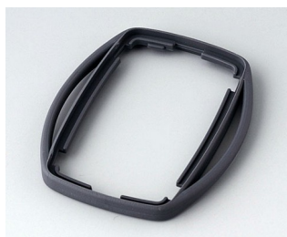
B9002752 Bague intermédiaire ES TPE lava