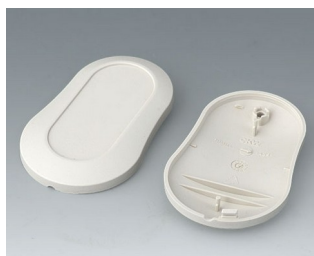
B9004907 Partie inférieure et supérieure DM ABS (UL 94 HB) gris blanc RAL 9002 70x44x16mm