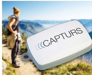
Tracker GPS en temps réel