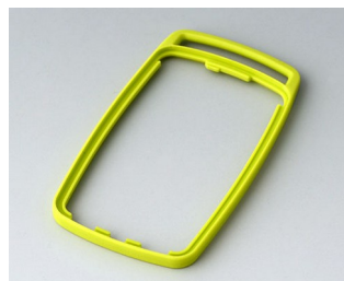
B9004704 Bague intermédiaire EM TPE vert