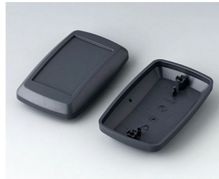
B9006828 Partie inférieure et supérieure EL ABS (UL 94 HB) lava 78x48x26mm