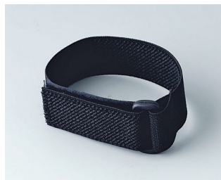
B9100033 Bracelet noir 280mm