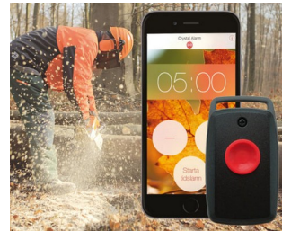
Une alarme personnelle sur votre Smartphone