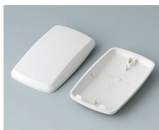
B9004857 Partie inférieure et supérieure EM ABS (UL 94 HB) gris blanc RAL 9002 68x42x18mm