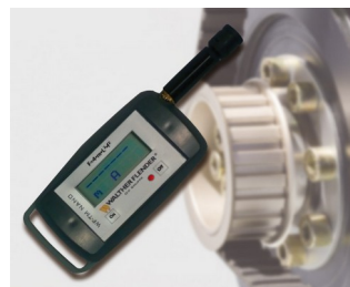
Tensiomètre pour mesurer la prétention de courroies