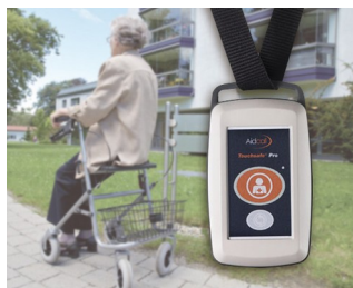
Émetteur radio pour système d'appel d'urgence patient