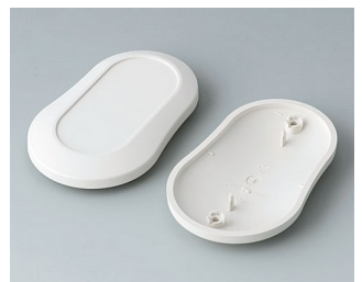
B9006907 Partie inférieure et supérieure DL ABS (UL 94 HB) gris blanc RAL 9002 84x53x19mm