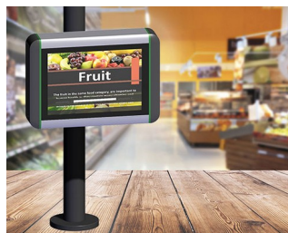
Borne d'information dans les points de vente