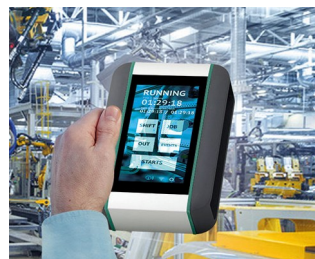
Système de surveillance en temps réel de la machine