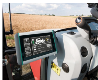
Terminal ISOBUS pour tracteurs et machines agricoles