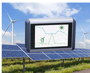
Système intelligent pour l'énergie éolienne et les systèmes solaires