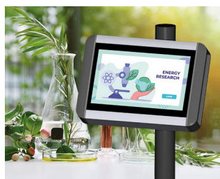
Terminal de recherche végétale