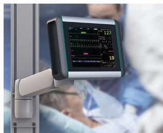
Moniteur de surveillance des signes vitaux