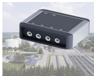
Contrôle de processus des usines