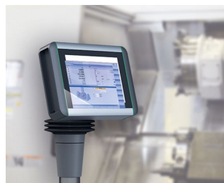
Panneau multi-touch pour le contrôle de la machine