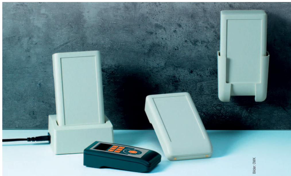
Das Zubehör der Gehäuserreihe umfasst passende Wandhalterungen und Sockel.