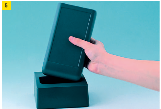
1) Das Unterteil des Gehäuses besitzt ein integriertes Batteriefach.