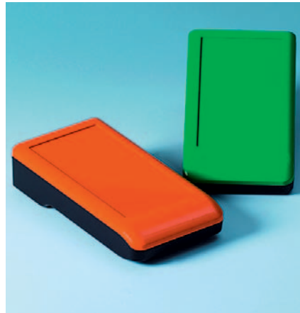
Die Farbgebung der Gehäuse ist wählbar, sie lässt sich gemäß der Kunden-Corporate Identity-Richtlinien (CI) realisieren.

Daneben hat diese Variante weitere vorteilhafte Optionen: in dem geschützten Bereich ist ausreichend Platz für vielfältige SD-Karten und/oder USB-Stecker vorhanden. Diese lassen sich einfach und schnell unter dem Batteriefachdeckel einsetzen und erreichen. Insgesamt hat dieses Areal fünf Möglichkeiten, um SD-Karten unterzubringen. Durch die eingeschäumten Dichtungen erreicht die Gehäuselinie die Schutzart IP65 und setzen einen hohen Si-