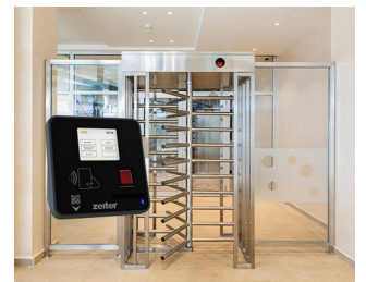
Terminal for access control