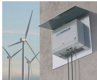
Controller wind turbines