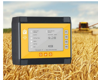
Data recording for harvesters