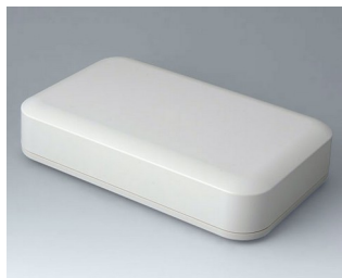
A9481107 EVOTEC 250, Vers. I ASA+PC (UL 94 V-0) off-white RAL 9002 250x155x54mm IP 65 opt., IP 40