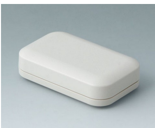
A9401107 EVOTEC 80, Vers. I ASA+PC (UL 94 V-0) off-white RAL 9002 80x50x22mm IP 65 opt., IP 40