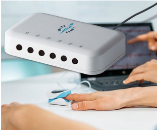
Biofeedback device for stress parameters

Tecnologías de medición y control, tecnologías de regulación, tecnologías de medicina y laboratorio, tecnologías medioambientales, tecnologías de la información, IoT/IIoT, ecc.