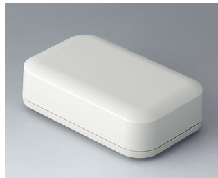
A9433107 EVOTEC 125, Vers. I ASA+PC (UL 94 V-0) off-white RAL 9002 125x78x37mm IP 65 opt., IP 40