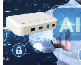
Interface for smart systems