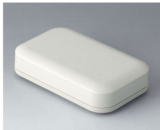
A9431107 EVOTEC 125, Vers. I ASA+PC (UL 94 V-0) off-white RAL 9002 125x78x30mm IP 65 opt., IP 40