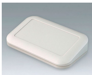
A9446107 EVOTEC 150, Vers. III ASA+PC (UL 94 V-0) off-white RAL 9002 150x93x36mm IP 65 opt., IP 40