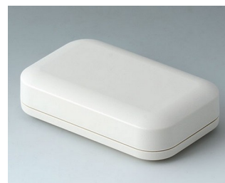
A9421107 EVOTEC 100, Vers. I ASA+PC (UL 94 V-0) off-white RAL 9002 100x62x26mm IP 65 opt., IP 40