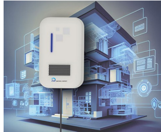
Electronic control system