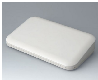
A9485107 EVOTEC 250, Vers. II ASA+PC (UL 94 V-0) off-white RAL 9002 250x155x54mm IP 65 opt., IP 40