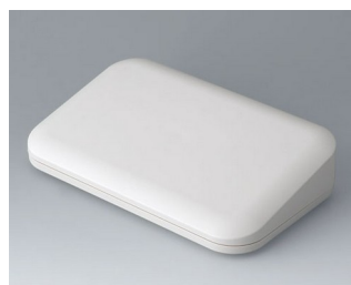
A9465107 EVOTEC 200, Vers. II ASA+PC (UL 94 V-0) off-white RAL 9002 200x124x45mm IP 65 opt., IP 40