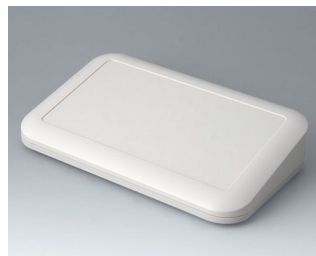
A9486107 EVOTEC 250, Vers. III ASA+PC (UL 94 V-0) off-white RAL 9002 250x155x54mm IP 65 opt., IP 40