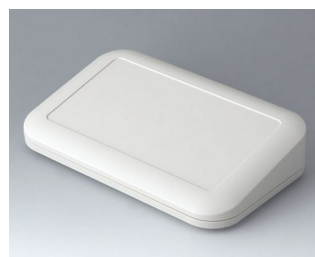
A9466107 EVOTEC 200, Vers. III ASA+PC (UL 94 V-0) off-white RAL 9002 200x124x45mm IP 65 opt., IP 40