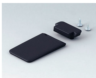
A9152059 Tilt foot bar ABS (UL 94 HB) black RAL 9005