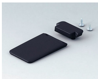
A9152059 Tilt foot bar ABS (UL 94 HB) black RAL 9005