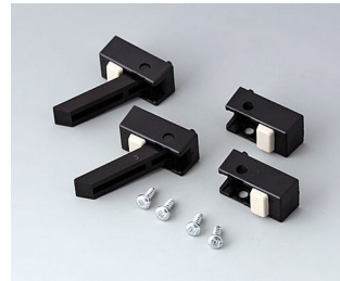
A9257209 Case feet, Vers. II ABS (UL 94 HB) black RAL 9005