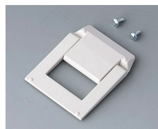
A9250817 Tilt foot bar ABS (UL 94 HB) off-white RAL 9002