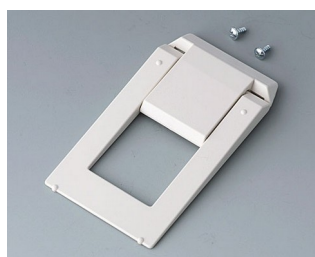
A9250807 Tilt foot bar ABS (UL 94 HB) off-white RAL 9002