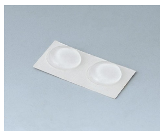
A9210180 Anti-slide feet 10,1 x 1.8 mm transparent