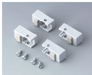
A9257105 Case feet, Vers. I ABS (UL 94 HB) light grey RAL 7035