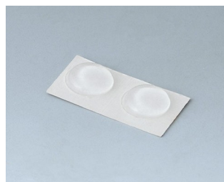
A9210180 Anti-slide feet 10,1 x 1.8 mm transparent