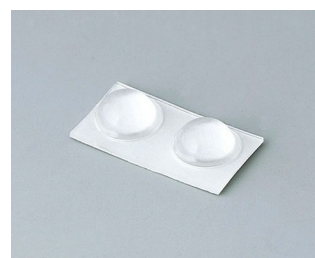
A9210290 Anti-slide feet 9.5 x 3.8 mm transparent