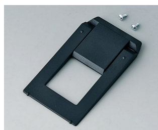
A9250809 Tilt foot bar ABS (UL 94 HB) black RAL 9005