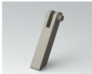
A0350008 Tilt foot ABS (UL 94 HB) pebble grey RAL 7032