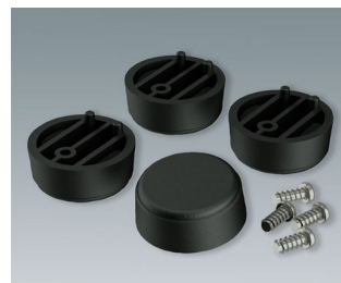
A9257409 Case feet, Vers. I ABS (UL 94 HB) black RAL 9005 ø30x12mm