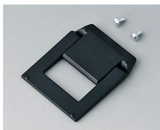
A9250819 Tilt foot bar ABS (UL 94 HB) black RAL 9005