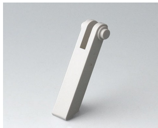
A0350007 Tilt foot ABS (UL 94 HB) off-white RAL 9002