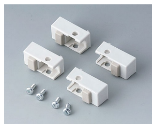
A9257107 Case feet, Vers. I ABS (UL 94 HB) off-white RAL 9002