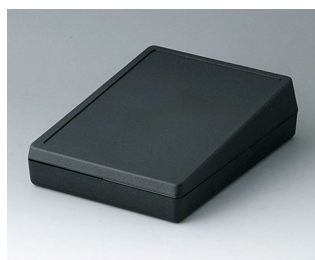
A0514009 DESK CASE 138 ABS (UL 94 HB) black RAL 9005 138x190x54mm