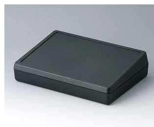
A0519009 DESK CASE 190 ABS (UL 94 HB) black RAL 9005 190x138x47mm