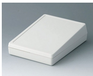
A0514007 DESK CASE 138 ABS (UL 94 HB) off-white RAL 9002 138x190x54mm