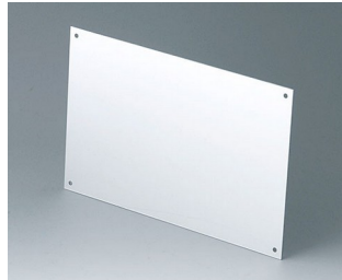
A9184001 Front panel Aluminium matt anodised 200x130x1,5mm