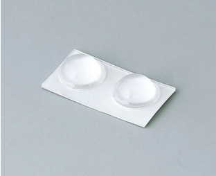
A9210290 Anti-slide feet 9.5 x 3.8 mm transparent

Nos reservamos el derecho a realizar modificaciones técnicas. © OKW Gehäusesysteme, Buchen (Alemania).