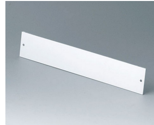
A9185001 Front panel Aluminium matt anodised 200x35x1,5mm