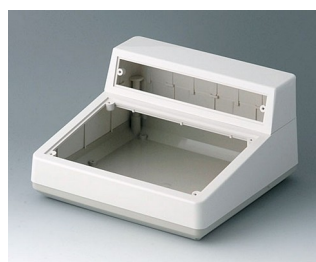
A9085165 COMBI DESK CASE H ABS (UL 94 HB) off-white RAL 9002 228x216x126mm