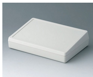
A0519007 DESK CASE 190 ABS (UL 94 HB) off-white RAL 9002 190x138x47mm