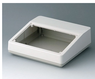
A9084165 COMBI DESK CASE F ABS (UL 94 HB) off-white RAL 9002 228x216x76mm