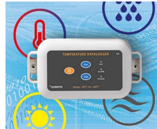
Data logger e.g. for temperature