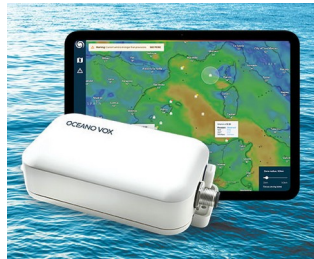
Data Collection for Ocean Observation network