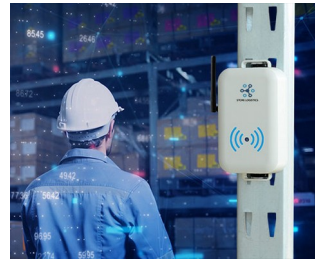
Smart store logistics