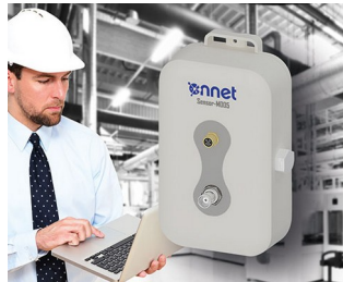
Sensor box for process monitoring