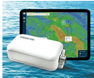
Data Collection for Ocean Observation network