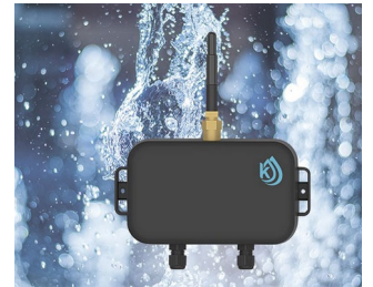
Water level monitoring