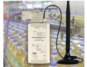
PROFIBUS radio system