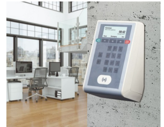
Time recording terminal