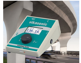
Ultrasonic measuring device