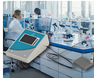
Measuring device for a research laboratory