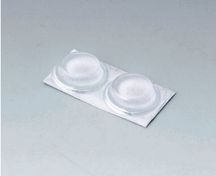
A9212330 Anti-slide feet 12 x 3.5 mm transparent

Nos reservamos el derecho a realizar modificaciones técnicas. © OKW Gehäusesysteme, Buchen (Alemania).