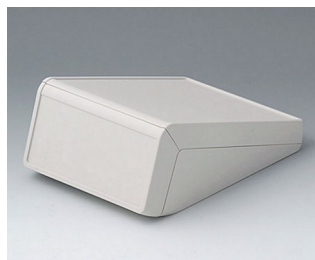
B4056117 UNITEC M, 1.4/1.4 ABS (UL 94 HB) off-white RAL 9002 148x210x80mm IP 40