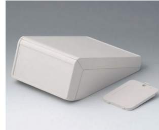
B4056227 UNITEC M, 1.4/0.6 ABS (UL 94 HB) off-white RAL 9002 148x210x80mm IP 40