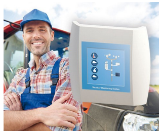
Weather Monitoring Station