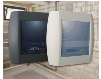
Systems for drying brickwork