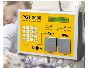
System for preventing electrostatic charges