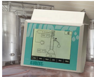
Device for monitoring and controlling distillation units