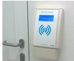
RFID access control readers