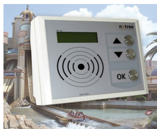
Versatile terminal for leisure facilities