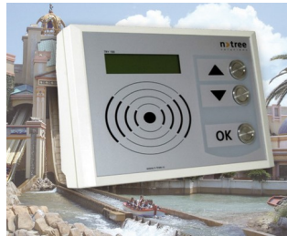
Versatile terminal for leisure facilities