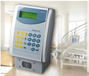
Terminal for time recording, access control and order management