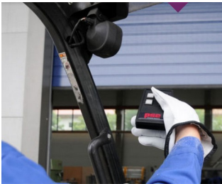
IR remote control for harsh environments

Ideal para emisores y receptores de impulsos, tecnologías de medición y regulación, emisores de impulsos de ultrasonidos e infrarrojos, mandos a distancia de diversos tipos, comunicación inalámbrica, recopilación móvil de datos, ecc.