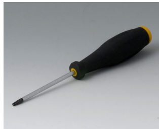
A0399T08 Torx T8 screwdriver

Nos reservamos el derecho a realizar modificaciones técnicas. © OKW Gehäusesysteme, Buchen (Alemania).