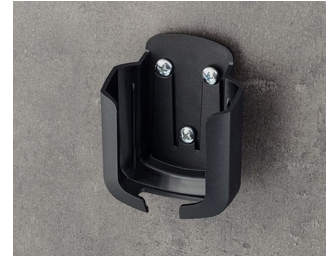
B2931509 Holder ASA+PC-FR (UL 94 V-0) black RAL 9005