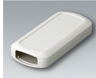
B2833107 CONNECT ASA+PC-FR (UL 94 V-0) off-white RAL 9002 116x54x22mm