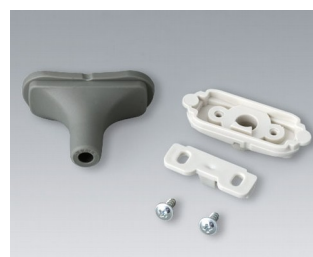
B2911328 Cable gland kit, 5.0 - 5.9 SEBS (TPE) volcano