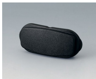
B2811209 End part ASA+PC-FR (UL 94 V-0) black RAL 9005