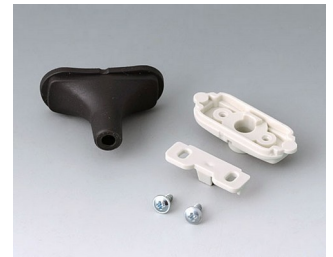
B2911329 Cable gland kit, 5.0 - 5.9 TPE black RAL 9005