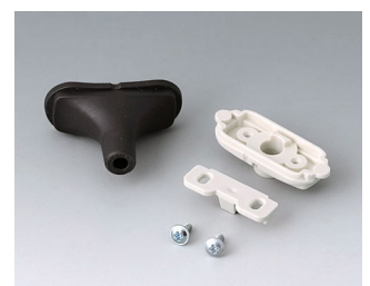
B2911329 Cable gland kit, 5.0 - 5.9 SEBS (TPE) black RAL 9005