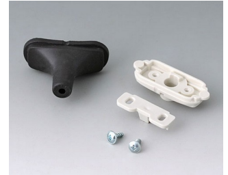
B2911309 Cable gland kit, 3.4 - 4.2 TPE black RAL 9005