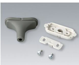
B2911318 Cable gland kit, 4.2 - 5.0 SEBS (TPE) volcano