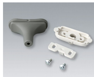
B2911308 Cable gland kit, 3.4 - 4.2 SEBS (TPE) volcano