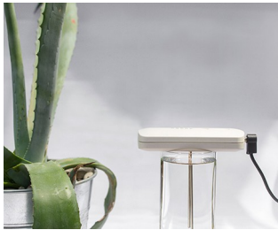
Tool for making colloidal silver solutions