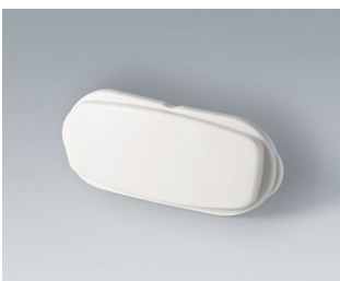
B2811207 End part ASA+PC-FR (UL 94 V-0) off-white RAL 9002