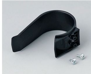
A9167029 Holding clamp PA 6 (UL 94 HB) black RAL 9005