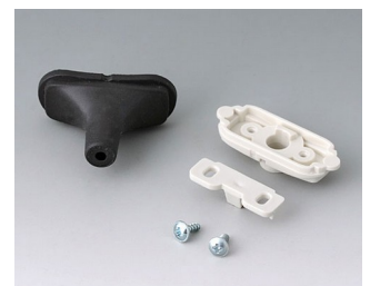
B2911309 Cable gland kit, 3.4 - 4.2 SEBS (TPE) black RAL 9005