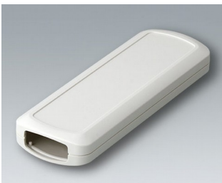
B2834107 CONNECT ASA+PC-FR (UL 94 V-0) off-white RAL 9002 156x54x22mm