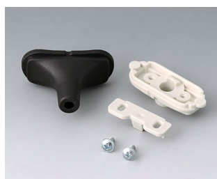
B2911319 Cable gland kit, 4.2 - 5.0 SEBS (TPE) black RAL 9005