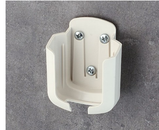
B2931507 Holder ASA+PC-FR (UL 94 V-0) off-white RAL 9002