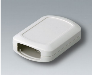
B2832107 CONNECT ASA+PC-FR (UL 94 V-0) off-white RAL 9002 76x54x22mm