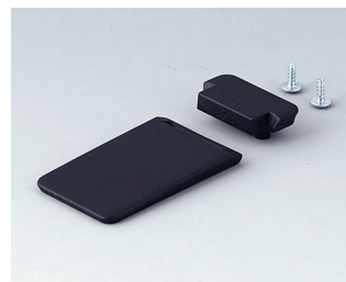
A9152059 Tilt foot bar ABS (UL 94 HB) black RAL 9005

Nos reservamos el derecho a realizar modificaciones técnicas. © OKW Gehäusesysteme, Buchen (Alemania).