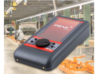
Mobile diagnostic device for CAN and CAN FD buses