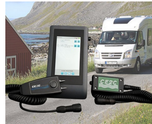
System for leak detection in leisure vehicles