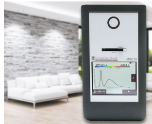
Spectral light meter