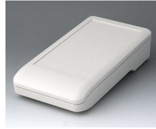
A9007117 DATEC-COMPACT L ASA+PC (UL 94 V-0) off-white RAL 9002 206x110x47mm IP 41