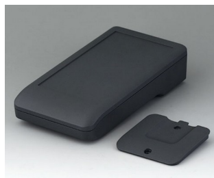
A9006208 DATEC-COMPACT M ASA+PC (UL 94 V-0) lava 172x92x39mm IP 65