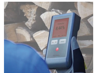
Wood moisture measuring device