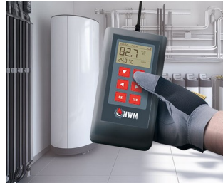
Measuring device for heating water