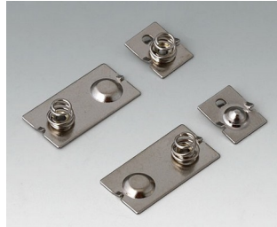
A9190024 Set of battery clips, 3 x AAA Steel nickel-plated