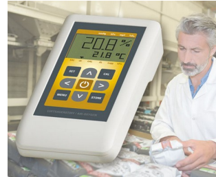
Medidor del oxígeno del aire