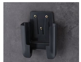
A9106628 Holder M ASA+PC (UL 94 V-0) lava