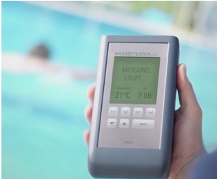
Electronic pool tester

Recopilación móvil de datos, tecnologías de medición y regulación, tecnologías de control, tecnologías de medicina y laboratorio, tecnologías medioambientales, exteriores, smart factory, industry 4.0, ecc.