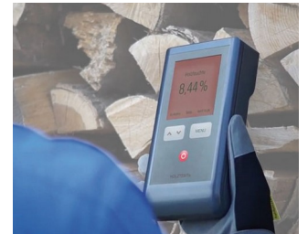
Wood moisture measuring device