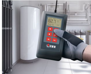
Measuring device for heating water