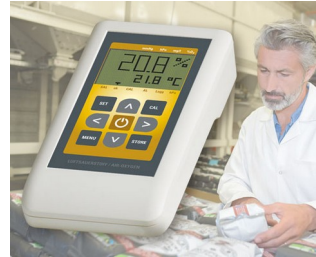
Medidor del oxígeno del aire