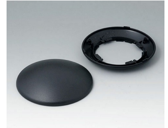
B5010109 Bottom and top part R110 H ABS (UL 94 HB) black RAL 9005 ø110x38mm