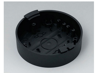
B5011119 Base ABS (UL 94 HB) black RAL 9005