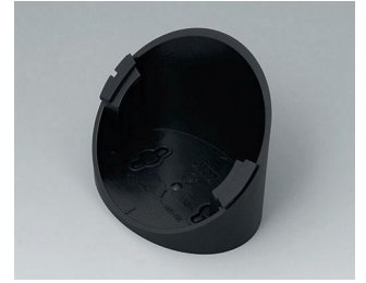
B5011319 Base 55° ABS (UL 94 HB) black RAL 9005