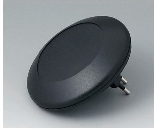
B5011229 ART-CASE R110 F PC+ABS (UL 94 V-0) black RAL 9005 ø110x38mm IP 40