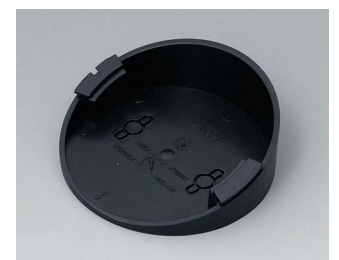
B5011219 Base 30° ABS (UL 94 HB) black RAL 9005