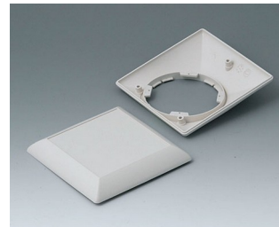
B5012207 Bottom and top part S110 F ABS (UL 94 HB) off-white RAL 9002 110x110x38mm