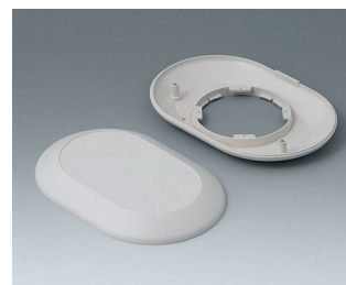
B5015007 Bottom and top part O160 F ABS (UL 94 HB) off-white RAL 9002 160x110x30mm