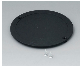
B5011859 Battery compartment lid ABS (UL 94 HB) black RAL 9005