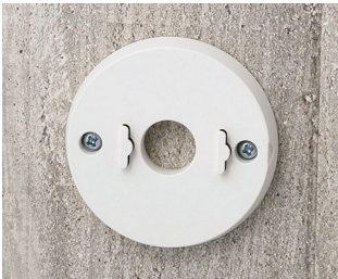
B5111307 Wall mounting set ABS (UL 94 HB) off-white RAL 9002