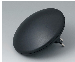
B5011329 ART-CASE R110 H PC+ABS (UL 94 V-0) black RAL 9005 ø110x41mm IP 40