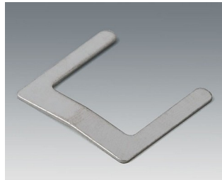
A9166002 Battery contact, 2 x AAA Steel tin-plated