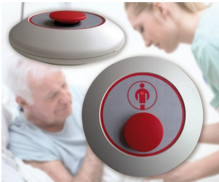
Radio paging mushroom-type button