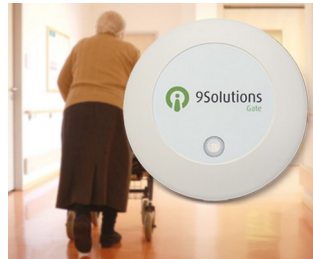
Access management in care facilities