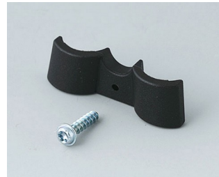
A9166003 Battery holder, 2 x AAA PA 6 (UL 94 HB) black RAL 9005