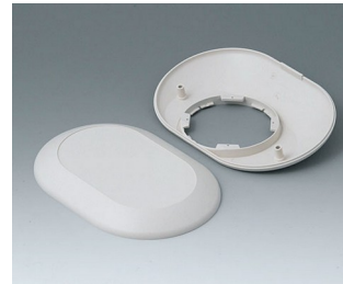
B5015207 Bottom and top part O160 F ABS (UL 94 HB) off-white RAL 9002 160x110x38mm