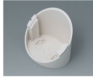
B5011317 Base 55° ABS (UL 94 HB) off-white RAL 9002