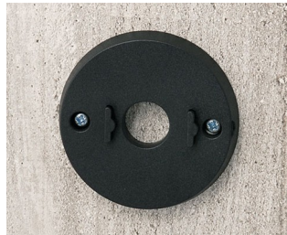
B5111309 Wall mounting set ABS (UL 94 HB) black RAL 9005