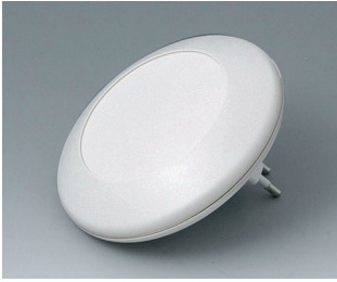
B5011227 ART-CASE R110 F PC+ABS (UL 94 V-0) off-white RAL 9002 ø110x38mm IP 40