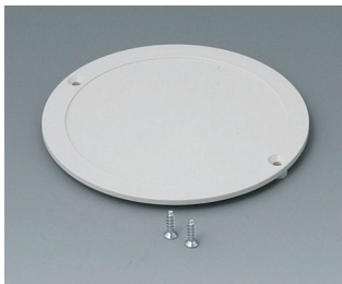
B5011857 Battery compartment lid ABS (UL 94 HB) off-white RAL 9002