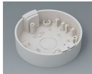
B5011117 Base ABS (UL 94 HB) off-white RAL 9002