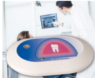
RFID Reader for the CTV system