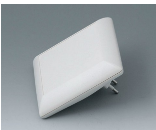
B5013227 ART-CASE S110 F PC+ABS (UL 94 V-0) off-white RAL 9002 110x110x38mm IP 40