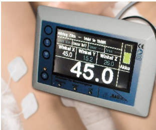
3D angle measurement of articulation systems on a gravity basis

Pensada para aplicaciones eléctricas y electrónicas en interiores, como, por ejemplo unidades de emisión y recepción en tecnologías para hogares y edificios, medicina, salud, periféricos informáticos, tecnologías de redes, tecnologías de seguridad, etc.