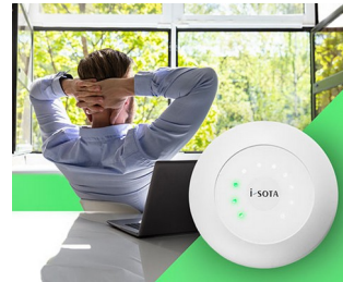
CO2 sensor traffic light