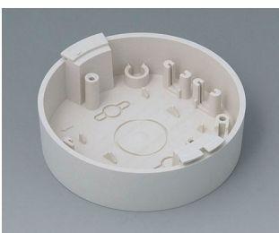
B5011117 Base ABS (UL 94 HB) off-white RAL 9002