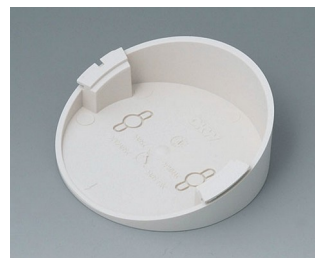
B5011217 Base 30° ABS (UL 94 HB) off-white RAL 9002