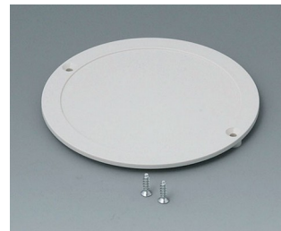
B5011847 Lid ABS (UL 94 HB) off-white RAL 9002