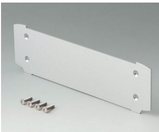
B3507025 Aluminium end plate Aluminium matt anodised