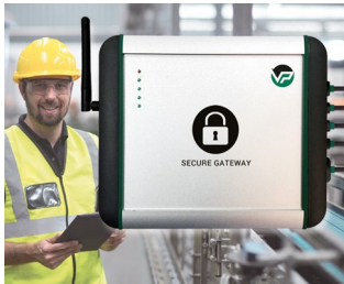
Industrial Secure Gateway

Dispositivos periféricos y de interfaz, oficina, tecnologías de comunicación, tecnologías de seguridad, biometría, tecnologías de medicina y laboratorio, salud, automatización, smart factory, industrie 4.0, tecnologías de medición, regulación y control, ecc.