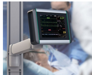
Surveillance monitor for vital signs