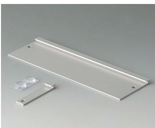
B3507020 Wall suspension element Aluminium