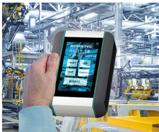
Machine real-time monitoring system