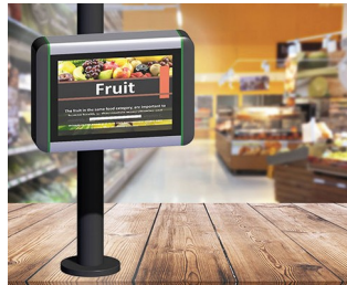
Information terminal at the point of sale