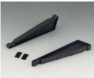
B3507030 Case canting kit ASA+PC (UL 94 V-0) lava