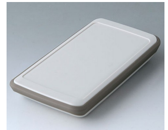
B5403217 SLIM-CASE M, Ausf. V ASA+PC (UL 94 V-0) grauweiß RAL 9002 148x74x22mm IP 54