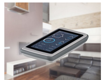
Smart Home Control