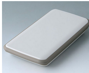
B5403117 SLIM-CASE M, Ausf. IV ASA+PC (UL 94 V-0) grauweiß RAL 9002 148x74x22mm IP 54