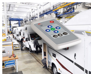
Fernbedienung für Interior Design