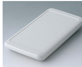
B5403207 SLIM-CASE M, Ausf. II ASA+PC (UL 94 V-0) grauweiß RAL 9002 148x74x19mm IP 65 opt., IP 40