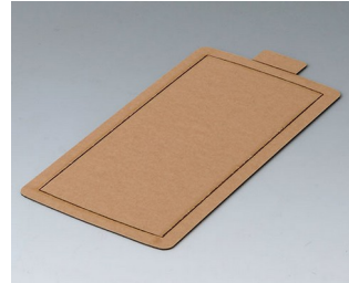
B5503300 Klebefolie M