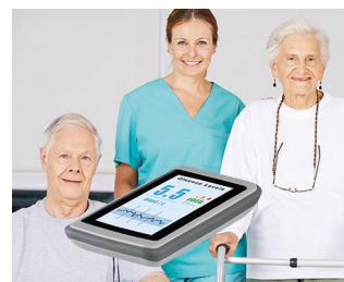
Messgerät / Monitoring System