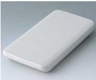
B5403107 SLIM-CASE M, Ausf. I ASA+PC (UL 94 V-0) grauweiß RAL 9002 148x74x19mm IP 65 opt., IP 40