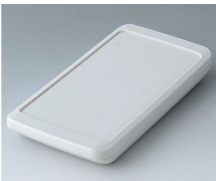
B5403307 SLIM-CASE M, Ausf. III ASA+PC (UL 94 V-0) grauweiß RAL 9002 148x74x19mm IP 65 opt., IP 40