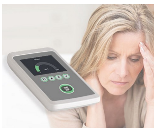
Biofeedback zum Stressabbau

Ideal für mobile Elektronikanwendungen im Innen- als auch im Außenbereich. Mess- und Regeltechnik, Drahtlose Kommunikation, IoT/IIoT, Labor- und Medizintechnik, Health Care, Office, Sicherheitstechnik, Umwelttechnik, etc.