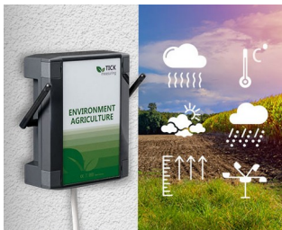
Wetterstation in der Landwirtschaft