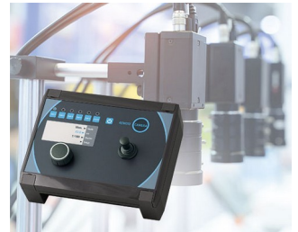
Kamera-Steuerung in der Produktion