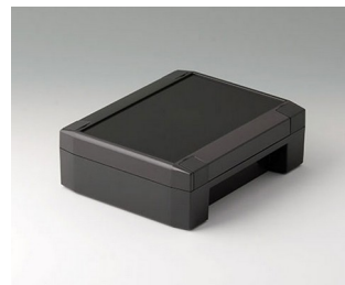
C8014181 SOLID-BOX 145 PC+ABS (UL 94 V-0) anthrazitgrau RAL 7016 180x145x60mm IP 66, IP 67, IK 08