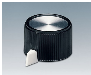
A1318560 DREHKNOPF, mit seitl. Schraubbefestigung PF schwarz/Alu 23,9x16mm 6mm