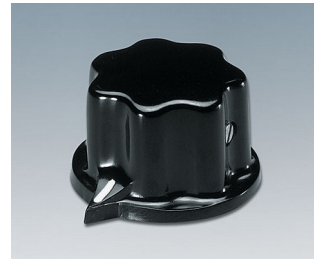
A1321060 DREHKNOPF, mit seidl. Schraubbefestigung PF schwarz RAL 9005 31x20mm 6mm