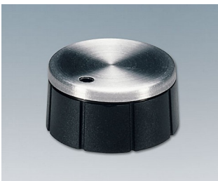
A1321260 DREHKNOPF, mit seidl. Schraubbefestigung PF schwarz/Alu 21x10mm 6mm