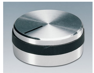
A1432469 DREHKNOPF, mit seidl. Schraubbefestigung ABS (UL 94 HB) glänzend 31,9x14mm 6mm