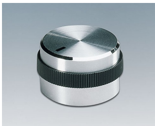
A1422469 DREHKNOPF, mit seidl. Schraubbefestigung ABS (UL 94 HB) glänzend 22,2x17,9mm 6mm