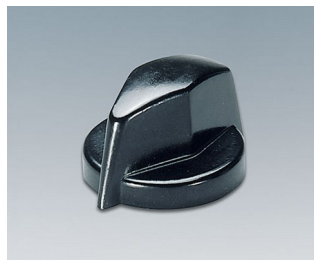
A1311860 DREHKNOPF, mit seitl. Schraubbefestigung PF schwarz RAL 9005 18,8x12,5mm 6mm