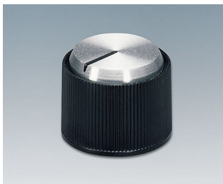
A1318260 DREHKNOPF, mit seitl. Schraubbefestigung ABS (UL 94 HB) schwarz/Alu 18,2x14,2mm 6mm