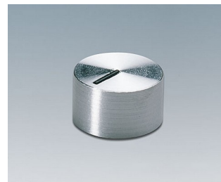
A1412461 DREHKNOPF, mit seidl. Schraubbefestigung PC glänzend 12x7,1mm 6mm