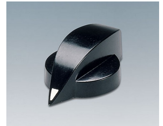
A1317860 DREHKNOPF, mit seitl. Schraubbefestigung PF schwarz RAL 9005 20,3x12,8mm 6mm