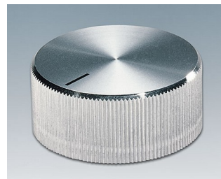
A1432261 DREHKNOPF, mit seidl. Schraubbefestigung ABS (UL 94 HB) glänzend 32,8x14,4mm 6mm