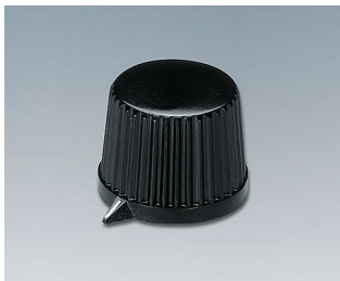
A1313560 DREHKNOPF, mit seitl. Schraubbefestigung PF schwarz RAL 9005 20x15,4mm 6mm