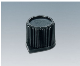
A1310560 DREHKNOPF, mit seitl. Schraubbefestigung PC schwarz RAL 9005 15,4x13,2mm 6mm