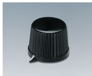
A1313540 DREHKNOPF, mit seidl. Schraubbefestigung PF schwarz RAL 9005 20x15,4mm 4mm