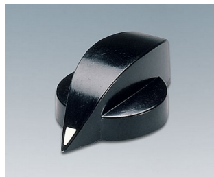
A1321860 DREHKNOPF, mit seidl. Schraubbefestigung PF schwarz RAL 9005 23x16mm 6mm