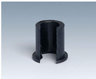
A1300040 Reduzierstück ABS (UL 94 HB) schwarz RAL 9005 7,4x7mm 4mm

Technische Änderungen vorbehalten. © OKW Gehäusesysteme, Buchen/Deutschland.