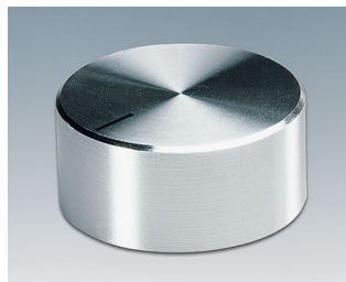
A1438461 DREHKNOPF, mit seidl. Schraubbefestigung ABS (UL 94 HB) glänzend 37,8x15,9mm 6mm