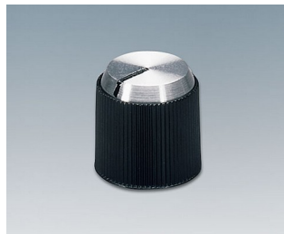
A1314240 DREHKNOPF, mit seitl. Schraubbefestigung PF schwarz/Alu 14,1x14mm 4mm