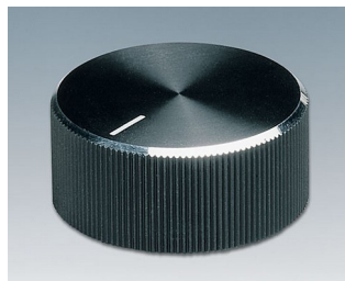
A1432260 DREHKNOPF, mit seidl. Schraubbefestigung ABS (UL 94 HB) schwarz/Alu 33x14,3mm 6mm