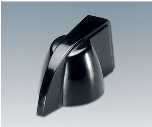
A1319860 DREHKNOPF, mit seidl. Schraubbefestigung PF schwarz RAL 9005 20,3x18mm 6mm