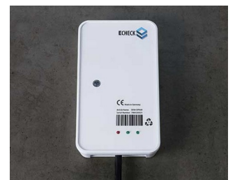
Kabelgebundenes Gerät im IIoT