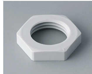
C2316117 Gegenmutter M16x1,5 PA 6 lichtgrau RAL 7035