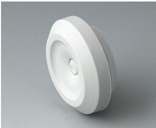
C2320147 Kabeldurchführung TPE lichtgrau RAL 7035