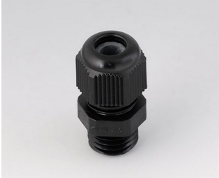
C2312419 Kabelverschraubung M12x1,5 PA 6 schwarz RAL 9005 IP 68 opt.