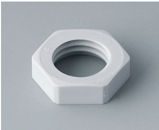
C2312117 Gegenmutter M12x1,5 PA 6 lichtgrau RAL 7035