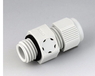
C2312917 Kabelverschraubung M12x1,5, mit Integriertem Druckausgleich PA 6 (UL 94 V-0) lichtgrau RAL 7035 IP 68