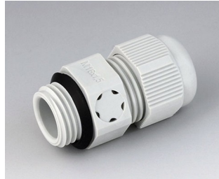
C2316917 Kabelverschraubung M16x1,5, mit Integriertem Druckausgleich PA 6 (UL 94 V-0) lichtgrau RAL 7035