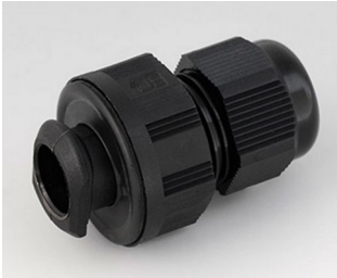
C2316719 Kabelverschraubung, M16, quick fix PA 6 schwarz RAL 9005