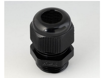
C2320419 Kabelverschraubung M20x1,5 PA 6 schwarz RAL 9005