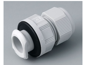
C2320717 Kabelverschraubung, M20, quick fix PA 6 lichtgrau RAL 7035