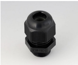
C2316419 Kabelverschraubung M16x1,5 PA 6 schwarz RAL 9005 IP 68 opt.