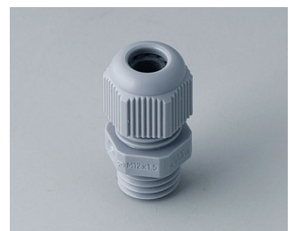
C2312418 Kabelverschraubung M12x1,5 PA 6 silbergrau RAL 7001