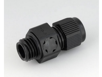
C2312919 Kabelverschraubung M12x1,5, mit Integriertem Druckausgleich PA 6 (UL 94 V-0) schwarz RAL 9005 IP 68