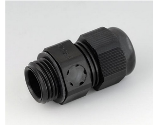
C2316919 Kabelverschraubung M16x1,5, mit Integriertem Druckausgleich PA 6 (UL 94 V-0) schwarz RAL 9005