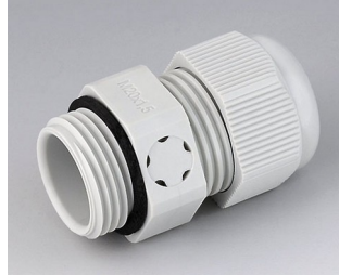
C2320917 Kabelverschraubung M20x1,5, mit Integriertem Druckausgleich PA 6 (UL 94 V-0) lichtgrau RAL 7035