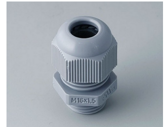
C2316418 Kabelverschraubung M16x1,5 PA 6 silbergrau RAL 7001 IP 68 opt.