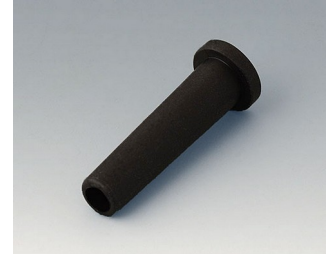
C2353849 Knickschutztülle Ø 5,3 schwarz