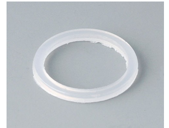
C2316126 Anschlussgewinde-Dichtring M16x1,5 PE naturfarben