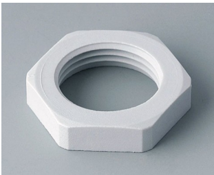
C2320117 Gegenmutter M20x1,5 PA 6 lichtgrau RAL 7035