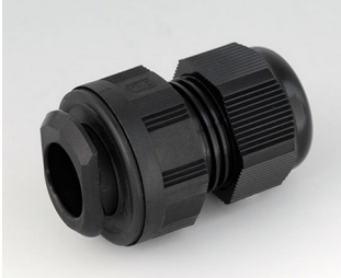
C2320719 Kabelverschraubung, M20, quick fix PA 6 schwarz RAL 9005