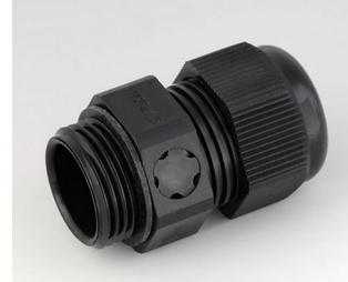
C2320919 Kabelverschraubung M20x1,5, mit Integriertem Druckausgleich PA 6 (UL 94 V-0) schwarz RAL 9005