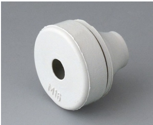
C2316137 Kabeldurchführung EPDM lichtgrau RAL 7035 IP 67