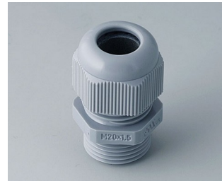
C2320418 Kabelverschraubung M20x1,5 PA 6 silbergrau RAL 7001