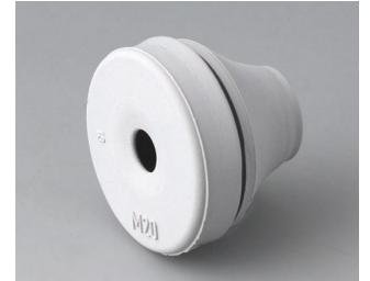
C2320137 Kabeldurchführung EPDM lichtgrau RAL 7035