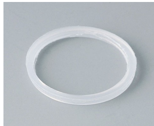
C2320126 Anschlussgewinde-Dichtring M20x1,5 PE naturfarben

Technische Änderungen vorbehalten. © OKW Gehäusesysteme, Buchen/Deutschland.