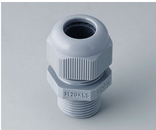
C2320428 Kabelverschraubung M20x1,5 PA 6 silbergrau RAL 7001