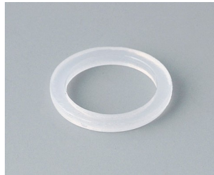
C2312126 Anschlussgewinde-Dichtring M12x1,5 PE naturfarben