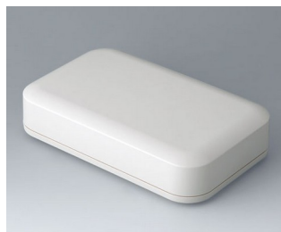
A9461107 EVOTEC 200, Ausf. I ASA+PC (UL 94 V-0) grauweiß RAL 9002 200x124x45mm IP 65 opt., IP 40