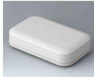
A9441107 EVOTEC 150, Ausf. I ASA+PC (UL 94 V-0) grauweiß RAL 9002 150x93x35mm IP 65 opt., IP 40