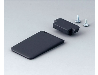
A9152058 Aufstellbügel ABS (UL 94 HB) lava