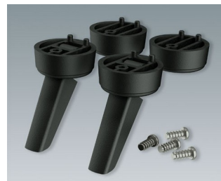
A9257509 Gehäusefüße, Ausf. II ABS (UL 94 HB) schwarz RAL 9005 ø30x12mm