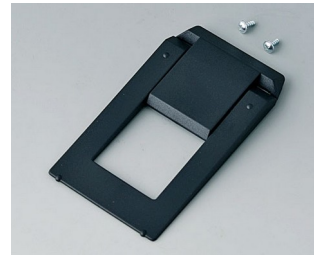
A9250809 Aufstellbügel ABS (UL 94 HB) schwarz RAL 9005