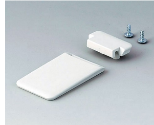
A9152057 Aufstellbügel ABS (UL 94 HB) grauweiß RAL 9002