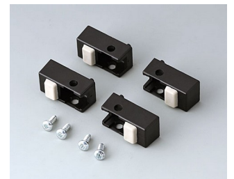
A9257109 Gehäusefüße, Ausf. I ABS (UL 94 HB) schwarz RAL 9005