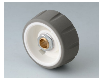
B7136064 CONTROL-KNOBS 36 PC vulkan 36x14,7mm 6mm