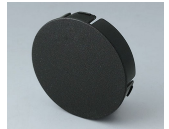
B7546109 Deckel 46 PA 6 nero