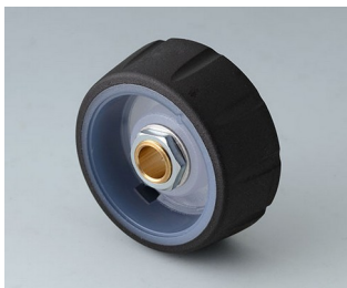
B7136061 CONTROL-KNOBS 36, optional beleuchtbar PC nero 36x14,7mm 6mm