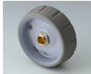
B7146063 CONTROL-KNOBS 46, optional beleuchtetbar PC vulkan 46x14,7mm 6mm