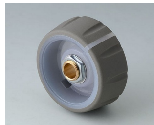
B7236063 CONTROL-KNOBS 36, optional beleuchtetbar PC vulkan 36x14,7mm 6mm