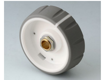
B7246064 CONTROL-KNOBS 46 PC vulkan 46x14,7mm 6mm