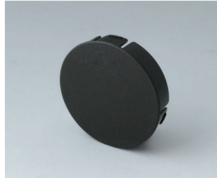
B7536109 Deckel 36 PA 6 nero