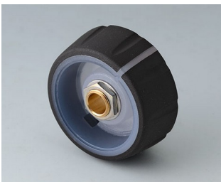
B7236061 CONTROL-KNOBS 36, optional beleuchtetbar PC nero 36x14,7mm 6mm