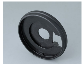
B7546209 Sockel 46 PA 6 nero