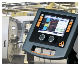
Bedienelemente für Maschinensteuerung