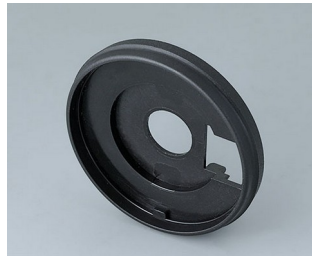
B7546209 Sockel 46 PA 6 nero

Technische Änderungen vorbehalten. © OKW Gehäusesysteme, Buchen/Deutschland.