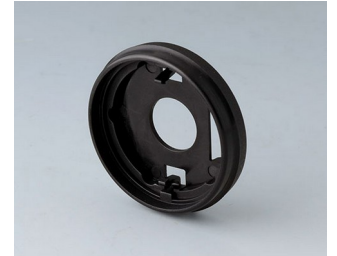
B7536209 Sockel 36 PA 6 nero