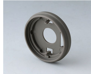
B7536208 Sockel 36 PA 6 vulkan