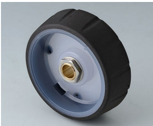
B7146631 CONTROL-KNOBS 46, optional beleuchtetbar PC nero 46x14,7mm 1/4"