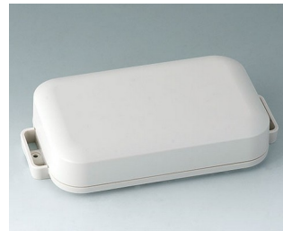
C3208107 EASYTEC 150 ASA+PC (UL 94 V-0) grauweiß RAL 9002 172x93x36mm IP 65 opt., IP 40