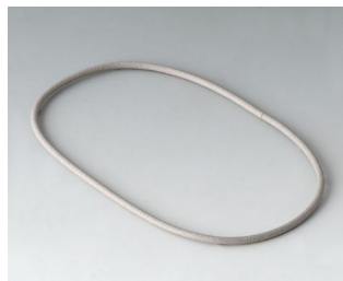
A9502030 Dichtung 100