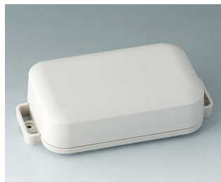
C3207207 EASYTEC 125 ASA+PC (UL 94 V-0) grauweiß RAL 9002 147x78x37mm IP 65 opt., IP 40