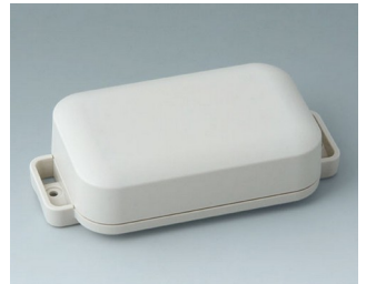
C3206207 EASYTEC 100 ASA+PC (UL 94 V-0) grauweiß RAL 9002 121x62x31mm IP 65 opt., IP 40