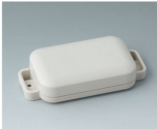
C3204107 EASYTEC 80 ASA+PC (UL 94 V-0) grauweiß RAL 9002 101x50x22mm IP 65 opt., IP 40