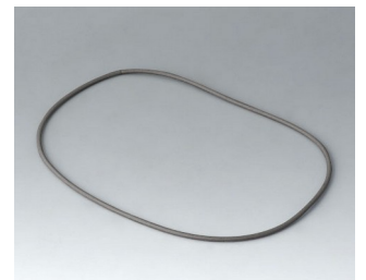
A9504030 Dichtung 150