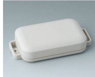
C3206107 EASYTEC 100 ASA+PC (UL 94 V-0) grauweiß RAL 9002 121x62x26mm IP 65 opt., IP 40