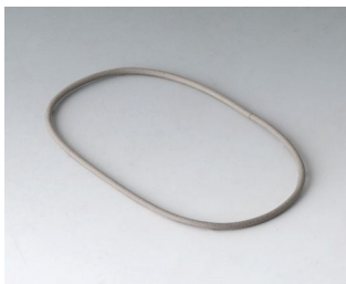
A9500030 Dichtung 80