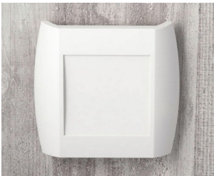
A9092107 DIATEC XS ABS (UL 94 HB) grauweiß RAL 9002 150x37x155mm IP 40