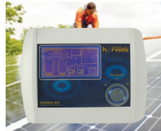
Steuerung der Photovoltaik-Solaranlage