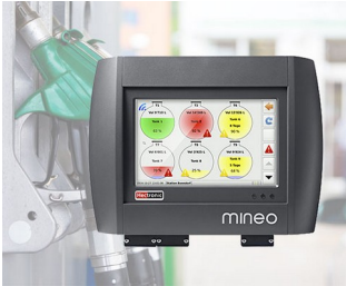
Controller für intelligentes Tankmanagement

Computerperipherie und Datentechnik, IoT/IIoT, Gateways, Datenerfassungssysteme am Arbeitsplatz, Sprech- und Überwachungsanlagen, Zugangskontrollgeräte, Mess- und Regeltechnik, Labor- und Medizintechnik, etc.