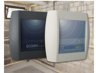
Systeme zur Mauerwerkstentfeuchtung