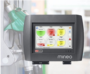
Controller für intelligentes Tankmanagement

Computerperipherie und Datentechnik, IoT/IIoT, Gateways, Datenerfassungssysteme am Arbeitsplatz, Sprech- und Überwachungsanlagen, Zugangskontrollgeräte, Mess- und Regeltechnik, Labor- und Medizintechnik, etc.