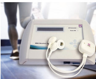
WBA-Empfangseinheit zur Messung von Biosignalen