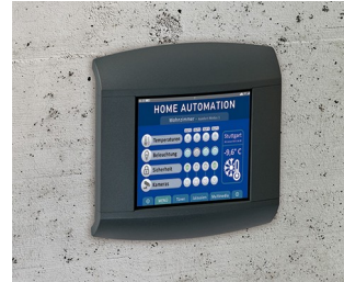
Kontrollpanel für Home Automation