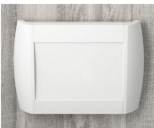
A9094107 DIATEC M ABS (UL 94 HB) grauweiß RAL 9002 270x48x200mm IP 40