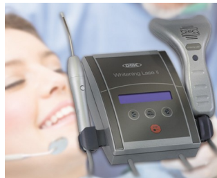
Zahnaufhellungssystem und Lasertherapie