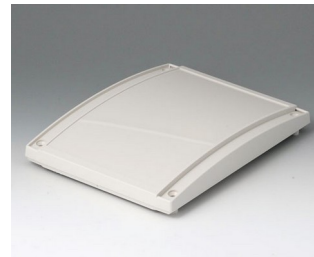
B4016637 Haube M, konvex ABS (UL 94 HB) grauweiß RAL 9002 168x220x29mm