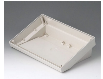
B4026117 DATEC-TERMINAL SL ABS (UL 94 HB) grauweiß RAL 9002 264x180x86mm IP 54 opt.