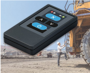
Funksender für Maschinen

Ideal für Impulsgeber und -empfänger, Mess- und Regeltechnik, Impulsgeber für Ultraschall und Infrarot, Sensorik, Optoelektronik, Fernsteuerungen vielfältiger Art, Drahtlose Kommunikation, Mobile Datenerfassung, etc.