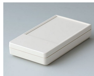
A9070117 DATEC-POCKET-BOX S ABS (UL 94 HB) grauweiß RAL 9002 85x46x16mm IP 54