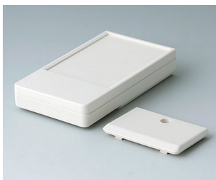
A9071117 DATEC-POCKET-BOX M ABS (UL 94 HB) grauweiß RAL 9002 105x58x18,5mm IP 54