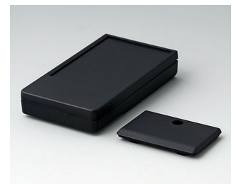
A9071219 DATEC-POCKET-BOX M PMMA (IR) (UL 94 HB) schwarz RAL 9005 105x58x18,5mm IP 54