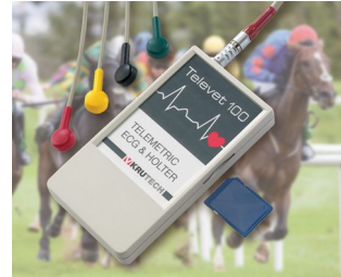
Telemetrisches EKG System für die Veterinärmedizin