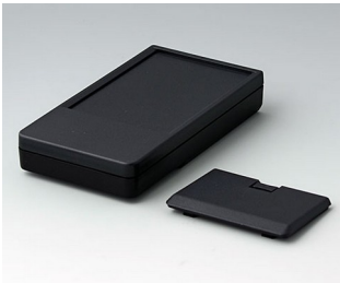
A9072229 DATEC-POCKET-BOX L PMMA (IR) (UL 94 HB) schwarz RAL 9005 120x65x22mm IP 41