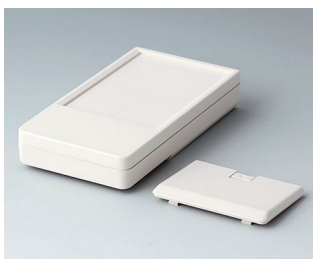
A9072127 DATEC-POCKET-BOX L ABS (UL 94 HB) grauweiß RAL 9002 120x65x22mm IP 41