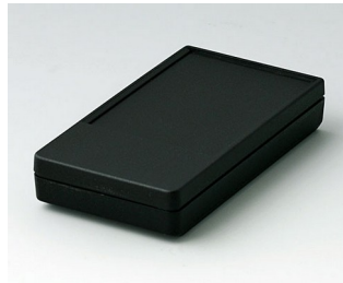
A9070219 DATEC-POCKET-BOX S PMMA (IR) (UL 94 HB) schwarz RAL 9005 85x46x16mm IP 54