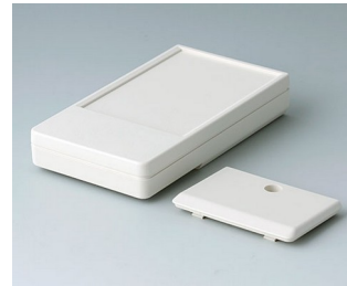
A9071107 DATEC-POCKET-BOX M ABS (UL 94 HB) grauweiß RAL 9002 105x58x18,5mm IP 41