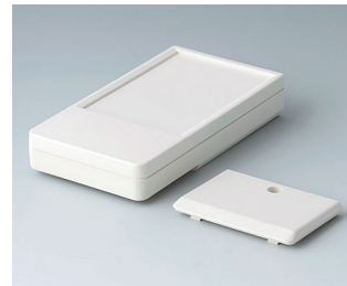
A9072117 DATEC-POCKET-BOX L ABS (UL 94 HB) grauweiß RAL 9002 120x65x22mm IP 54