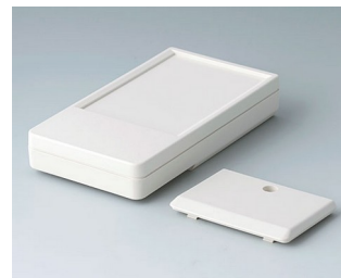
A9072117 DATEC-POCKET-BOX L ABS (UL 94 HB) grauweiß RAL 9002 120x65x22mm IP 54