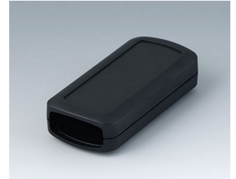
B2823109 CONNECT S ASA+PC (UL 94 V-0) schwarz RAL 9005 90x42x22mm