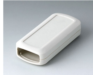
B2823107 CONNECT S ASA+PC (UL 94 V-0) grauweiß RAL 9002 90x42x22mm