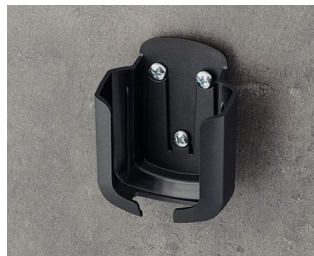
B2931509 Halteklammer ASA+PC (UL 94 V-0) schwarz RAL 9005