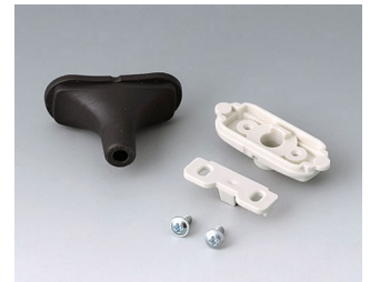
B2911329 Kabeltüllen-Set, 5,0 - 5,9 TPE schwarz RAL 9005