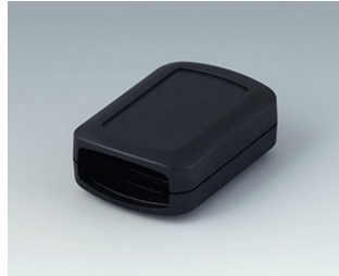
B2822109 CONNECT S ASA+PC (UL 94 V-0) schwarz RAL 9005 60x42x22mm