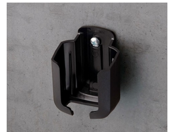
B2921509 Halteklammer ASA+PC (UL 94 V-0) schwarz RAL 9005