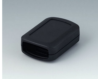
B2822109 CONNECT S ASA+PC (UL 94 V-0) schwarz RAL 9005 60x42x22mm