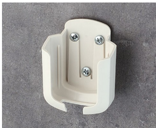
B2931507 Halteklammer ASA+PC (UL 94 V-0) grauweiß RAL 9002