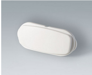
B2811207 Stirnteil ASA+PC (UL 94 V-0) grauweiß RAL 9002