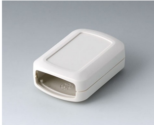
B2822107 CONNECT S ASA+PC (UL 94 V-0) grauweiß RAL 9002 60x42x22mm