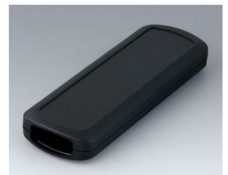
B2834109 CONNECT M ASA+PC (UL 94 V-0) schwarz RAL 9005 156x54x22mm