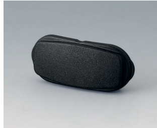
B2811209 Stirnteil ASA+PC (UL 94 V-0) schwarz RAL 9005