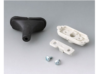
B2911309 Kabeltüllen-Set, 3,4 - 4,2 TPE schwarz RAL 9005