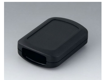
B2832109 CONNECT M ASA+PC (UL 94 V-0) schwarz RAL 9005 76x54x22mm