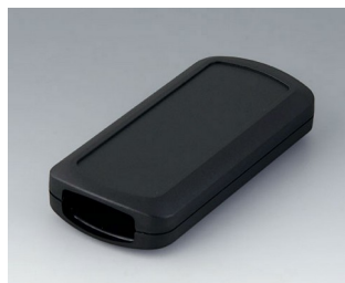
B2833109 CONNECT M ASA+PC (UL 94 V-0) schwarz RAL 9005 116x54x22mm