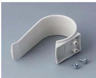
A9167027 Halteklammer PA 6 (UL 94 HB) grauweiß RAL 9002