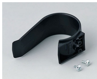
A9167029 Halteklammer PA 6 (UL 94 HB) schwarz RAL 9005