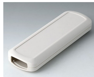
B2834107 CONNECT M ASA+PC (UL 94 V-0) grauweiß RAL 9002 156x54x22mm