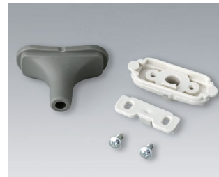
B2911328 Kabeltüllen-Set, 5,0 - 5,9 TPE vulkan