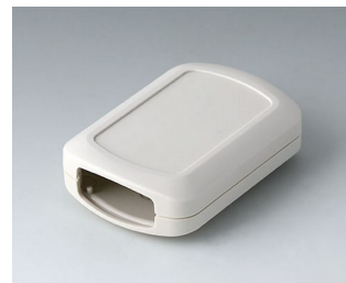
B2832107 CONNECT M ASA+PC (UL 94 V-0) grauweiß RAL 9002 76x54x22mm