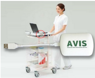
Receiver zur Datenübertragung in elektronische Krankenakte