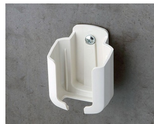
B2921507 Halter S ASA+PC (UL 94 V-0) grauweiß RAL 9002