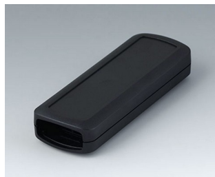
B2824109 CONNECT S ASA+PC (UL 94 V-0) schwarz RAL 9005 120x42x22mm