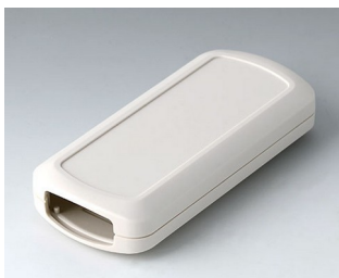
B2833107 CONNECT M ASA+PC (UL 94 V-0) grauweiß RAL 9002 116x54x22mm