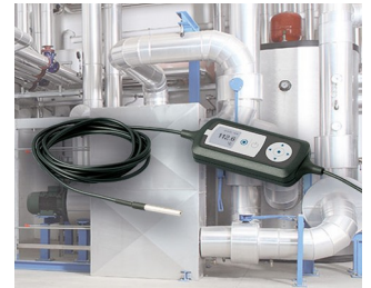
Prozessüberwachung mit Temperatursensor