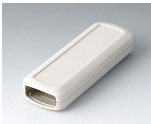
B2824107 CONNECT S ASA+PC (UL 94 V-0) grauweiß RAL 9002 120x42x22mm