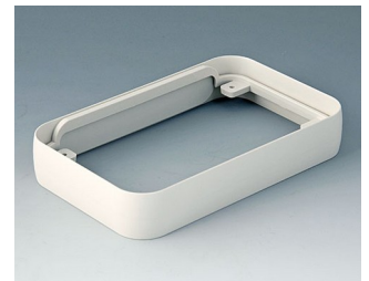
A9152017 Zwischenring L ABS (UL 94 HB) grauweiß RAL 9002 76x120x21mm