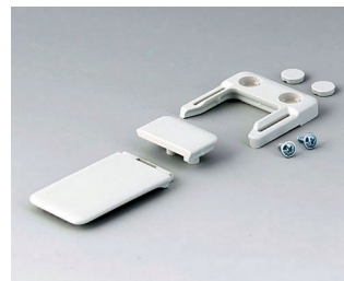
A9152047 Combi-Clip ABS (UL 94 HB) grauweiß RAL 9002 45x27mm