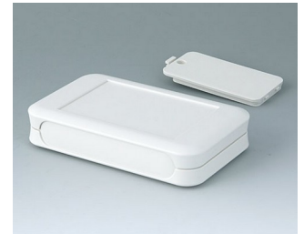
A9052117 SOFT-CASE L ABS (UL 94 HB) grauweiß RAL 9002 73x117x24mm IP 40