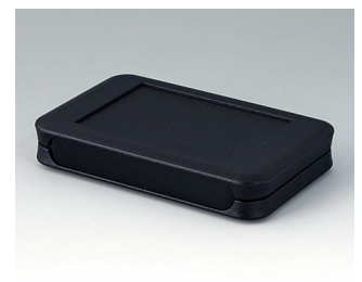
A9051209 SOFT-CASE M PMMA (IR) (UL 94 HB) schwarz RAL 9005 65x105x19mm IP 54 opt., IP 40