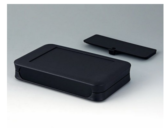
A9053219 SOFT-CASE XL PMMA (IR) (UL 94 HB) schwarz RAL 9005 92x150x28mm IP 40