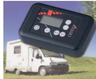
Fernbedienung für AutoSat Satellitenempfangsanlage