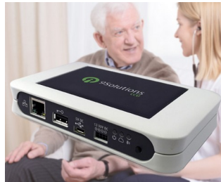
Echtzeitlokalisierung in der „Healthcare“