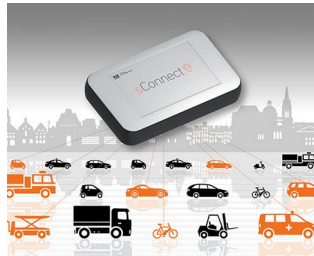
Modul für smarte Mobilitätsanwendungen