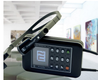
Multimedia-Audioguide für Museen