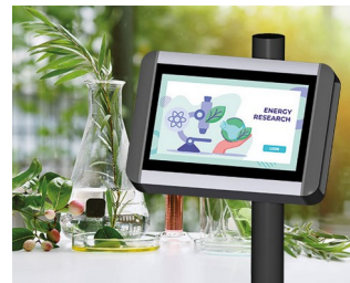
Terminal für Pflanzenforschung