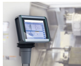
Multitouch-Panel für die Maschinensteuerung