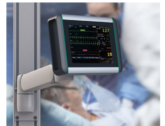
Überwachungsmonitor für Vitalfunktionen