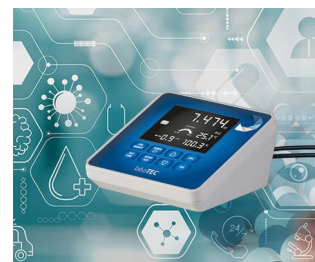
Laboratory measuring device