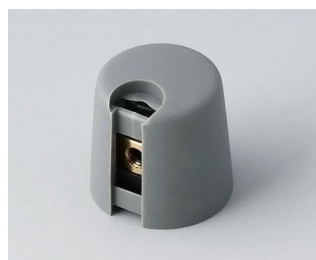
A1016068 TOP-KNOBS 16 PA 6 volcano 16x16mm 6mm