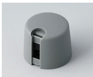
A1020648 TOP-KNOBS 20 PA 6 volcano 20x16mm