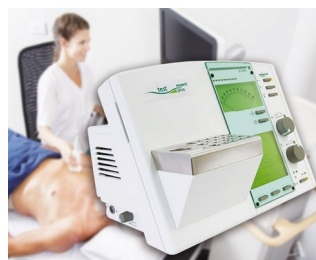
Operating element for a diagnostic device