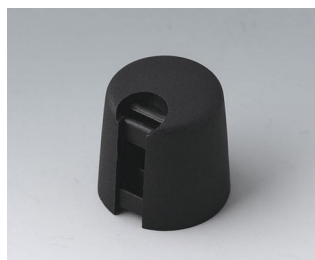
A1016649 TOP-KNOBS 16 PA 6 nero 16x16mm