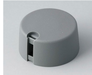
A1031048 TOP-KNOBS 31 PA 6 volcano 31x16mm 4mm