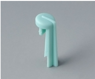
A1105005 Arrow PA 6 (UL 94 HB) lagoon