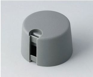
A1024648 TOP-KNOBS 24 PA 6 volcano 24x16mm