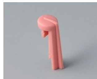
A1105003 Arrow PA 6 (UL 94 HB) coral