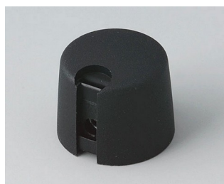
A1020649 TOP-KNOBS 20 PA 6 nero 20x16mm