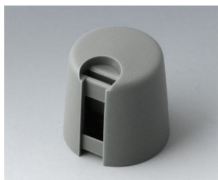
A1016648 TOP-KNOBS 16 PA 6 volcano 16x16mm