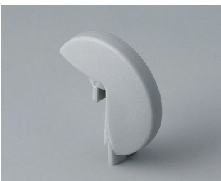
A1103007 Disk PA 6 (UL 94 HB) mineral