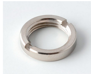
A6295009 Round nut 3/8"-32G

Subject to technical modification without notice. © by OKW Gehäusesysteme, Buchen/Germany.