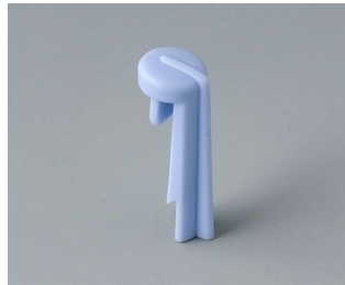
A1105006 Arrow PA 6 (UL 94 HB) sky