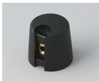
A1016049 TOP-KNOBS 16 PA 6 nero 16x16mm 4mm