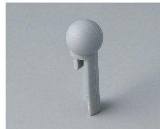
A1102007 Globe PA 6 (UL 94 HB) mineral