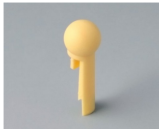
A1102004 Globe PA 6 (UL 94 HB) beach