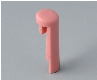
A1101003 Pin PA 6 (UL 94 HB) coral