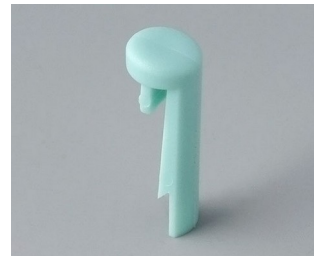
A1101005 Pin PA 6 (UL 94 HB) lagoon