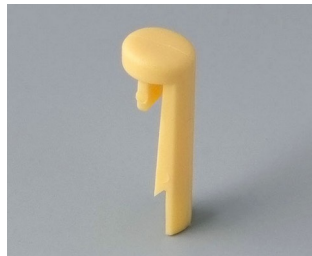
A1101004 Pin PA 6 (UL 94 HB) beach