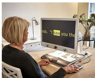
Control knobs for video magnifier

Pro otočné potenciometry s kulatými konci hřídelí podle DIN 41591 nebo zploštěnými konci hřídelí \varnothing 6 / 4,6 mm. Technologie měření a řízení, lékařská a laboratorní technika, wellness, zdravotní péče, topení a klimatizace, komunikace, budování, atd.