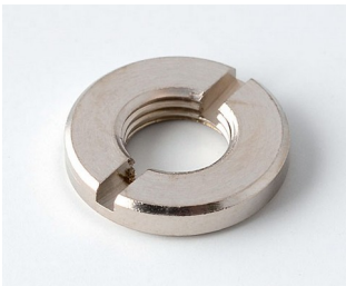
A6207009 Round nut M7 x 0.75