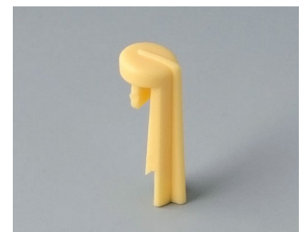
A1105004 Arrow PA 6 (UL 94 HB) beach