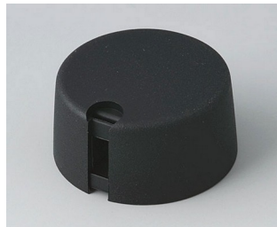
A1031649 TOP-KNOBS 31 PA 6 nero 31x16mm