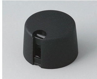
A1024649 TOP-KNOBS 24 PA 6 nero 24x16mm