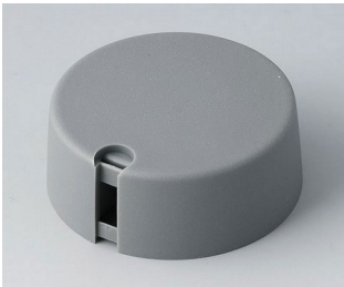
A1040648 TOP-KNOBS 40 PA 6 volcano 40x16mm