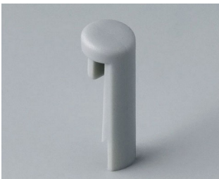
A1101007 Pin PA 6 (UL 94 HB) mineral