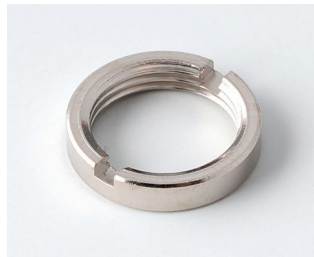
A6210009 Round nut M10 x 0.75