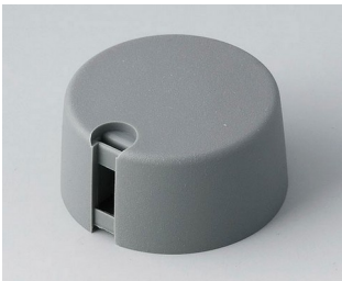
A1031648 TOP-KNOBS 31 PA 6 volcano 31x16mm