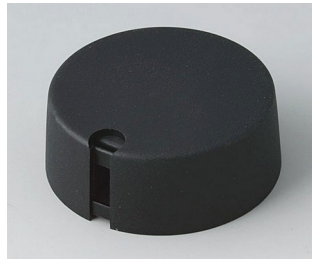
A1040649 TOP-KNOBS 40 PA 6 nero 40x16mm