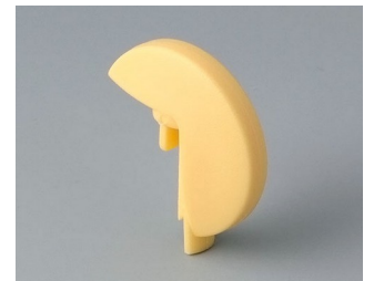
A1103004 Disk PA 6 (UL 94 HB) beach