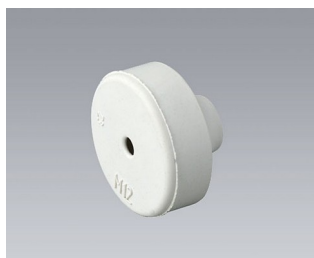
C2312137 Cable grommet EPDM light grey RAL 7035