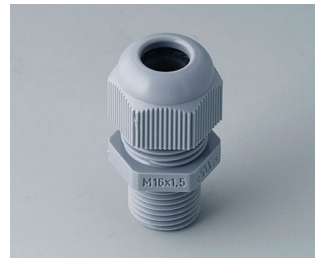
C2316618 Cable gland M16x1.5 PA 6 silver grey RAL 7001 IP 68