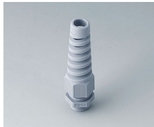
C2316518 Cable gland M16x1.5, bending protection PA 6 silver grey RAL 7001 IP 68