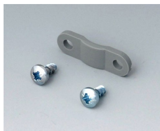
A9199005 Strain relief PA 6 volcano