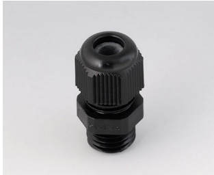
C2312419 Cable gland M12x1.5 PA 6 black RAL 9005 IP 68