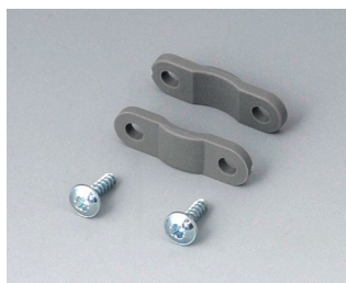
A9166004 Set of pull-relief PA 6 volcano