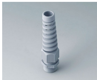
C2320518 Cable gland M20x1.5, bending protection PA 6 silver grey RAL 7001