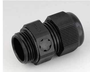
C2320919 Cable gland M20x1.5, pressure compensation PA 6 (UL 94 V-0) black RAL 9005 IP 68