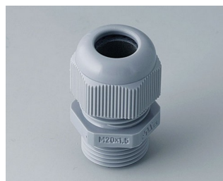
C2320418 Cable gland M20x1.5 PA 6 silver grey RAL 7001