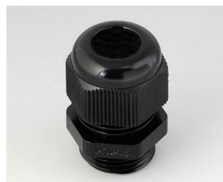
C2320419 Cable gland M20x1.5 PA 6 black RAL 9005