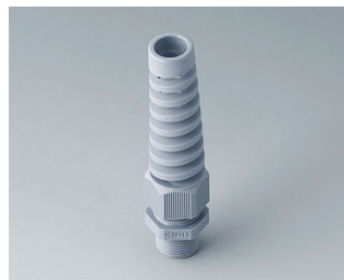
C2320528 Cable gland M20x1.5, bending protection PA 6 silver grey RAL 7001