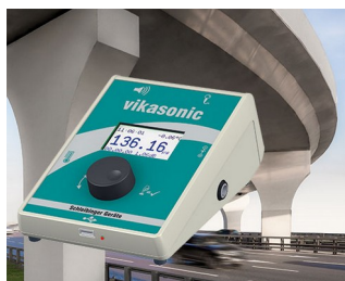
Ultrasonic measuring device