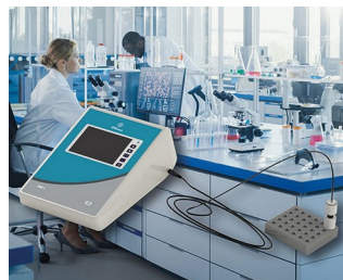
Measuring device for a research laboratory